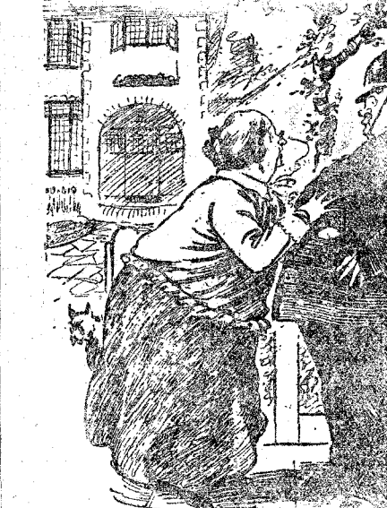
—Guardia, mi canario ha huido. Tenga la bondad de avisar a la escuadrilla de aviones de caza. ("London Opinion", Londres)