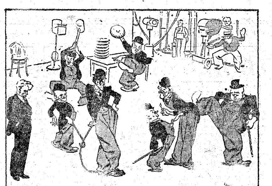
CHARLIE.—¡U! Esta película hablada afirma mi adhesión al cine mudo ("Glasgow Evening News").

unas sesenta conocidas personalidades para continuar las gestiones con objeto de constituir una agrupación monárquica, exclusivamente para los fines electorales próximos. Se nombraron comisiones a fin de continuar los trabajos que van por buen camino.