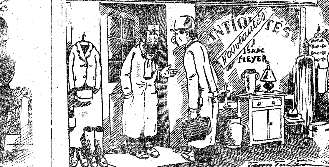
—La crisis es enorme. Yo antes vendía cosas nuevas al precio de antigüedades y ahora tengo que vender antigüedades al precio de cosas nuevas. ("Moustique" Charleiton)