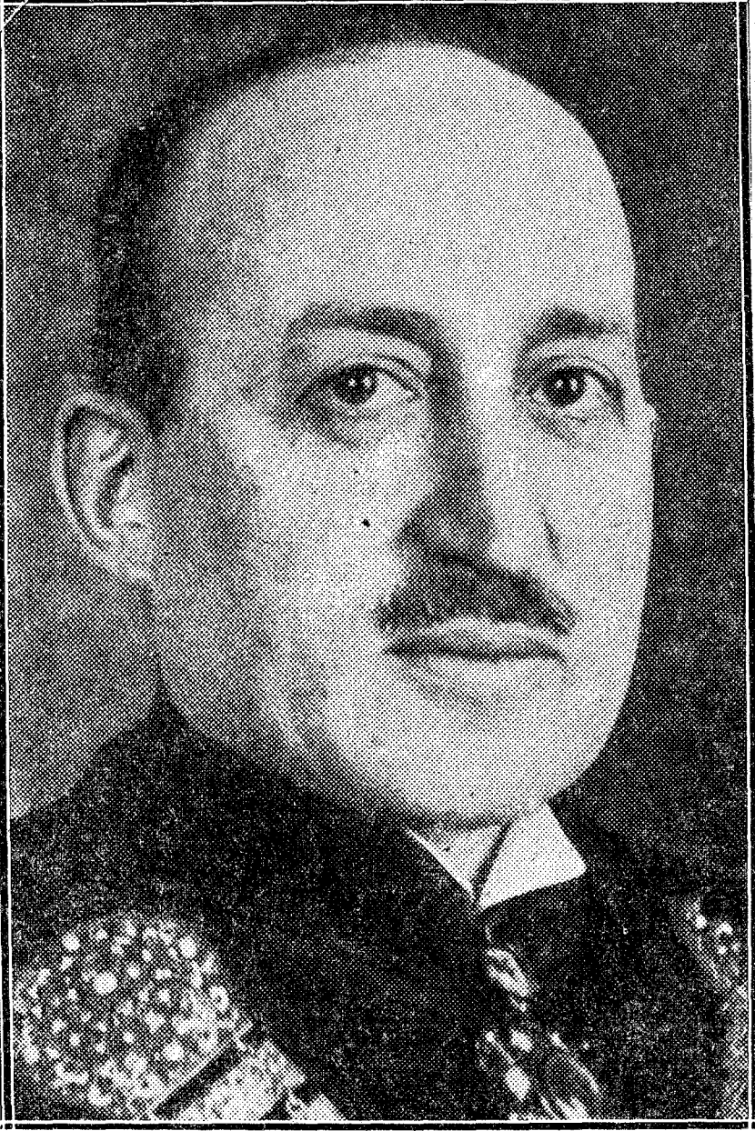
M. Paul de Hevesy de Heves, nuevo ministro de Hungría en España, que ayer presentó sus cartas credenciales

Esta presentación de credenciales ha tenido el rasgo simpático de que el señor de Hevesy leyó su discurso ante el Rey en castellano.