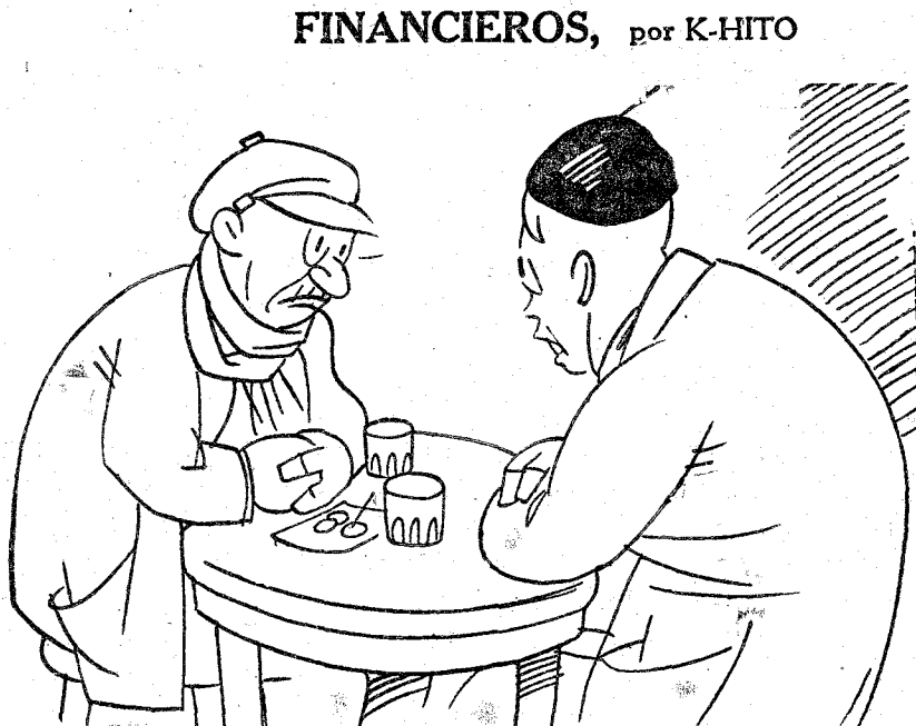
—Pero ¿qué es lo de la estabilización? —Pues na. ¿Tú ves que ahora no nos para una peseta en el bolsillo? Bueno; pues en cuanto la estabilicen se estará quieta.

El patriotismo de Maura. Maura, finalmente, es un patriota y maestro de ciudadanía. La Patria es una concepción subjetiva que descansa en las esperanzas y en los recuerdos. Entre los dos patriotismos que existen en el hombre, el marcial, antiguo como el mundo, hiperestésico, patriotismo de los días solemnes, y el civil, moderno de los días sencillos, de este último, que puede definirse como la general ciudadanía; es decir, la incorporación