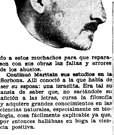
El camino de Damasco