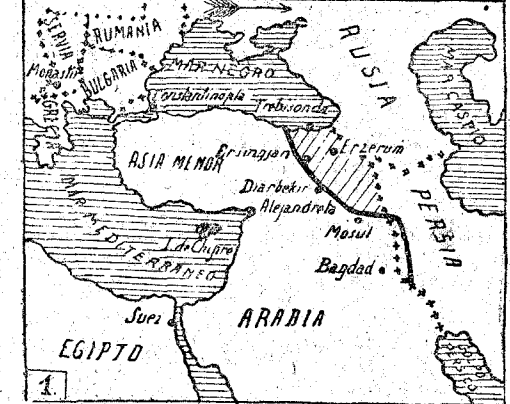
Frontes y posición de los rusos

Prometi ayer un croquis para que se vea cuál es, aproximadamente, la posición actual de la línea en este teatro de operaciones.