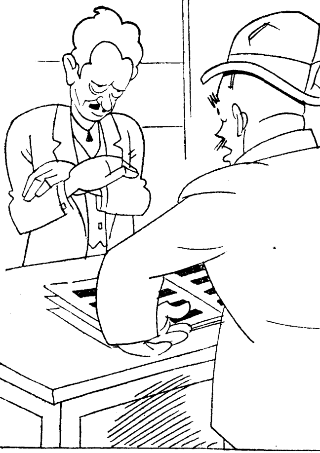
EL JEFE.—Ayer en la Casa de Campo... ¿Y hoy? EL SUBORDINADO.—Hoy, en el Monte... En el Monte de Piedad.