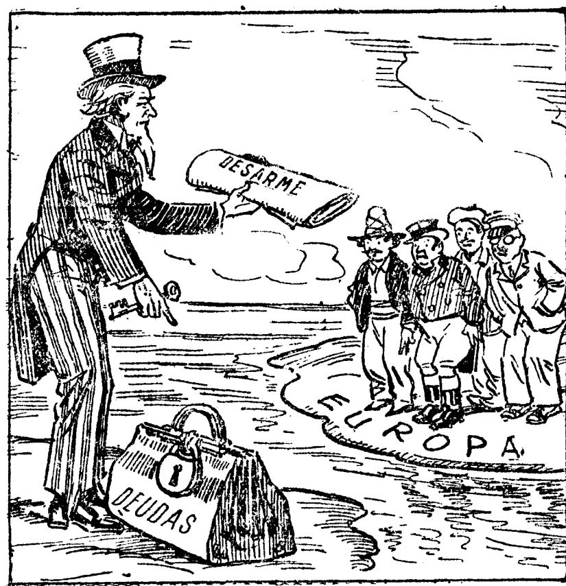
"Arreglad esto primero y abrid la maleta" ("Irish Weekly Independent, Dublin")

mente a Tablada, donde no encontré el menor obstáculo.