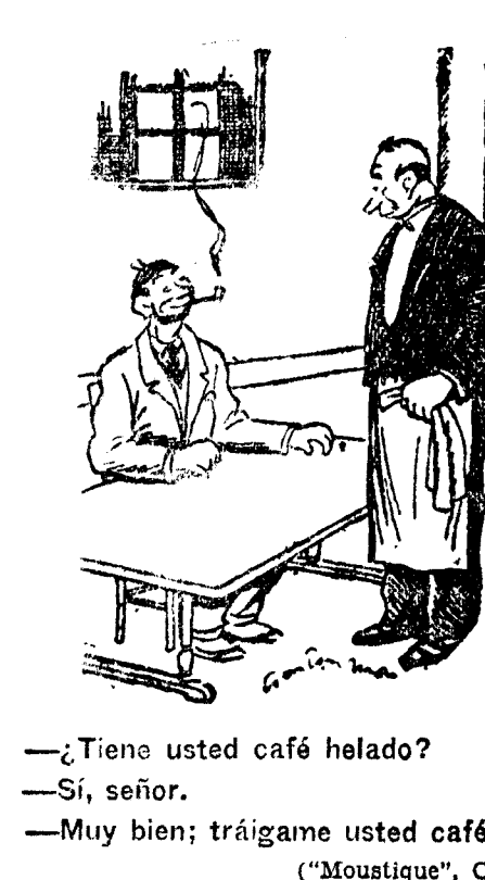
—¿Tiene usted café helado? —Sí, señor. —Muy bien; tráigame usted café caliente. ("Moustique", Charleroi)

LISBOA. 4.—El "Diario da Manha" publica hoy un editorial sobre la situacion politica que termina con las siguientes palabras: "La Dictadura debe trabajar con sinceridad y ardor para que la Unión Nacional adquiera más fuerza y para que se establezca el orden constitucional futuro, pero debe durar todo lo que sea necesario según el estado del país, sean las que fueren las actitudes y las consecuencias. Nada importan las opiniones y las astucias de los adversarios y de los que de cualquier modo se pueden confundir con ellos en las palabras o en los actos. A la Dictadura y a sus cooperadores pertenecen los derechos de la victoria y las obligaciones de la defensa pública. Nosotros no podemos pensar ni sentir a gusto de los revolucionarios y de los enemigos exteriores. Nuestra posición reflexiva y consciente ha de quedar marcada por la conveniencia del Estado y el amor a la patria.—Correia Marques.