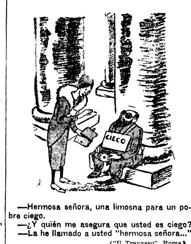
— Hermosa señora, una limosna para un pobre ciego. — ¿Y quién me asegura que usted es ciego? — La he llamado a usted "hermosa señora..." ("Il Travasso", Roma)