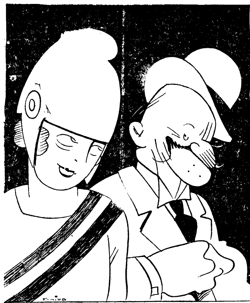
—¿Qué hombre tan simpático!