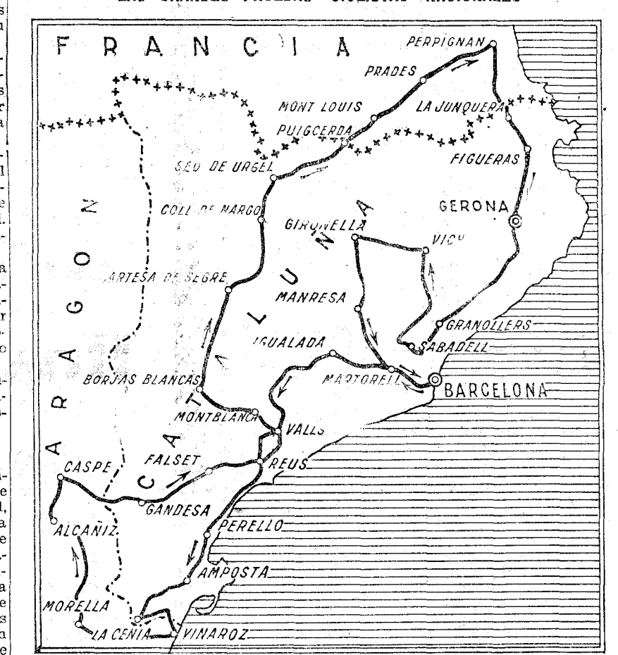
Recorrido de la próxima Vuelta a Cataluña