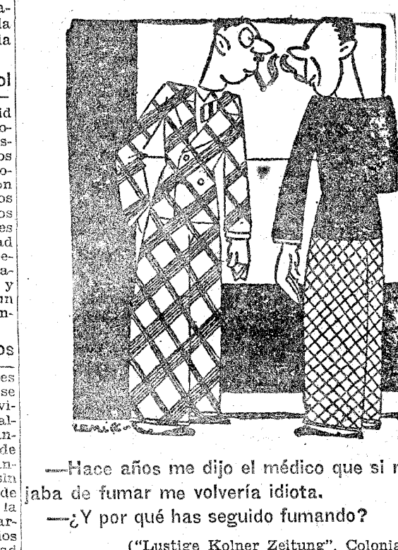
—Hace años me dijo el médico que si no dejaba de fumar me volvería idiota. —¿Y por qué has seguido fumando? ("Lustige Kölner Zeitung", Colonia.)

WASHINGTON, 9.—El embajador de España en los Estados Unidos, señor Salcedo Madariaga, pronunció el próximo sábado, a las diez y ocho cuarenta y cinco minutos, un discurso que será retransmitido a todos los puntos de los Estados Unidos. El discurso del embajador de España versará sobre la situación de su nación antes y después de la caída de la Monarquía.