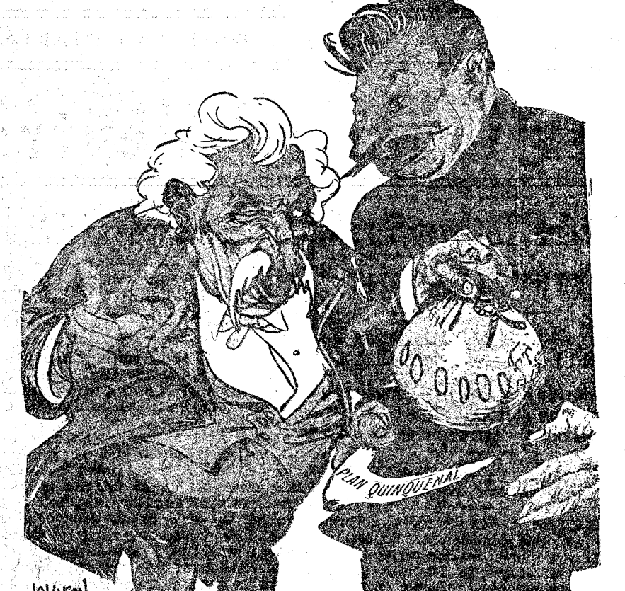
EL ACERCAMIENTO FRANCORRUSO.—Cuando os tengamos a vosotros (Rusia), el círculo estará completo. ("Kladderatsch", Berlín.)

urbanización de los pueblos rurales, porque como no se haga pronto vendrá la despoblación del campo. Yo creo que la solución del problema agrario está en la nacionalización de la tierra, que después de nacionalizada habría que arrendarla a los individuos o colectividades que quisieran explotarla. Claro que para ello habría que expropiarla, indemnizando a sus propietarios y esta indemnización la pagaría el Estado, no los arrendatarios. El reparto de tierras nunca puede ser una solución, porque es la base de la propiedad individual; quienes propugnan eso son profundamente reaccionarios. A la nacionalización podría llegarse creando un papel del Estado, por el que se pagara un interés. Los propietarios a quienes se expropiara cobrarían en ese papel, y el tanto por ciento que podría ser el 5, sería el canon que pagarán al Estado los arrendatarios. Refiriéndose a la participación de los socialistas en el Gobierno, dijo Largo Caballero: "Un abandono del Gobierno por parte de los socialistas pondría en peligro la República, y el partido no puede echar sobre sí esta responsabilidad. Opino que mientras se celebran las Constituyentes