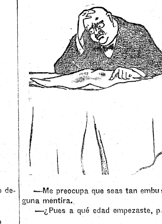
—Me preocupa que seas tan embustero. A tu edad no había dicho yo ninguna mentira. —¿Pues a qué edad empezaste, papá? ("Karikaturen", Oslo.)