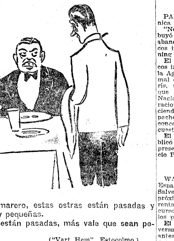
—Camarero, estas ostras están pasadas y son muy pequeñas. —Si están pasadas, más vale que sean pequeñas. ("Vart Hem", Estocolmo.)