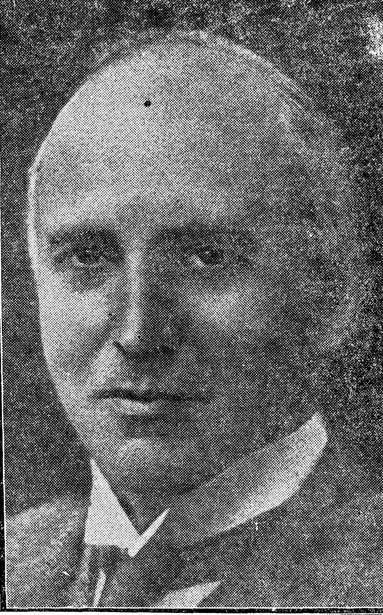
Sir John Simon, uno de los jefes del liberalismo inglés, que se ha separado del partido