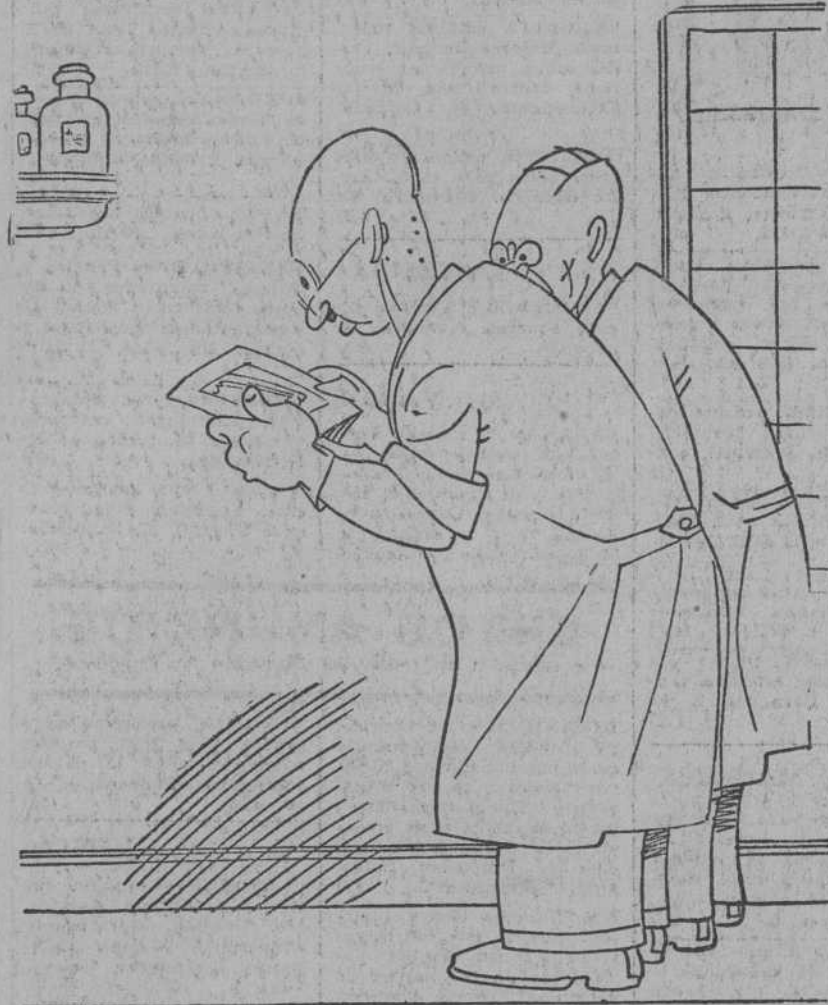
—Pues chico, no veo ningún indicio de si se "fracturó" a gran velocidad. No encuentro nada en el talón.