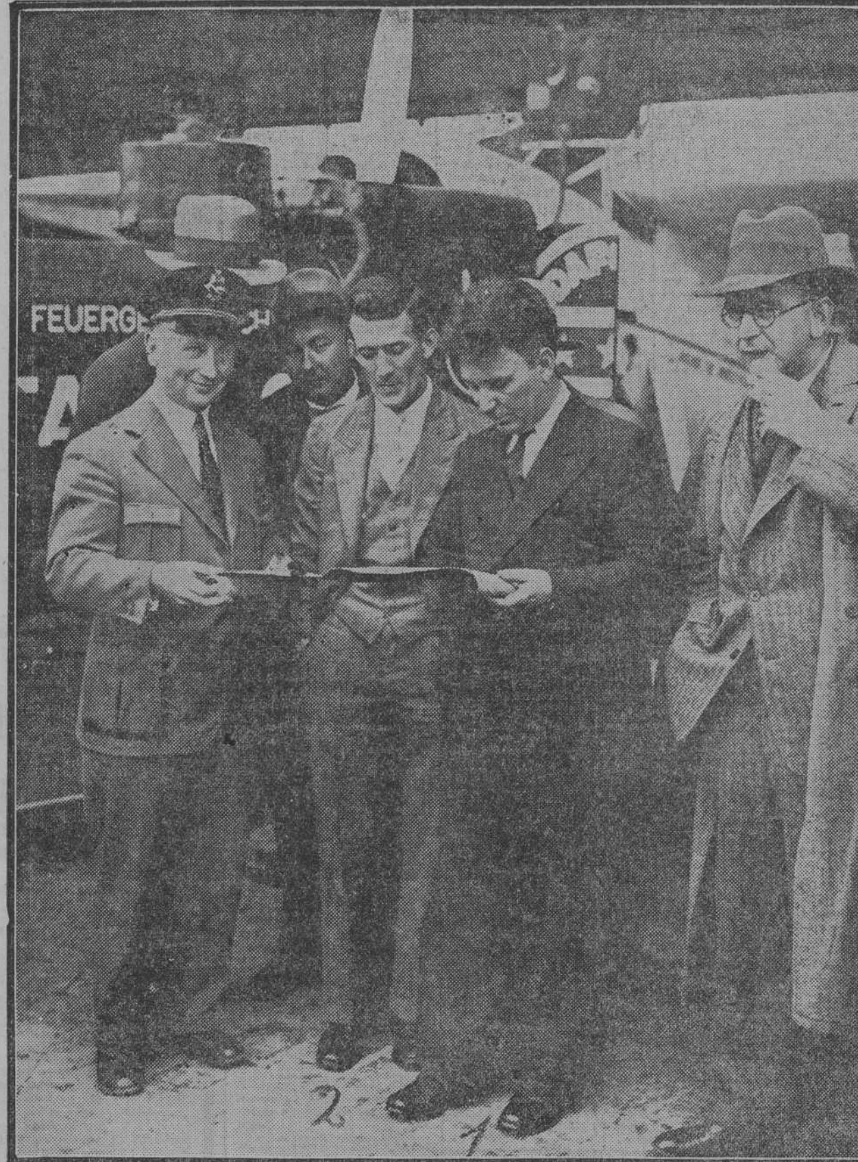
Los aviadores americanos Willie Post (1) y Harold Gatty (2), que el día 24 de junio aterrizaron en Berlín, después de cruzar el Atlántico, examinan los planos antes de partir al día siguiente para Moscú