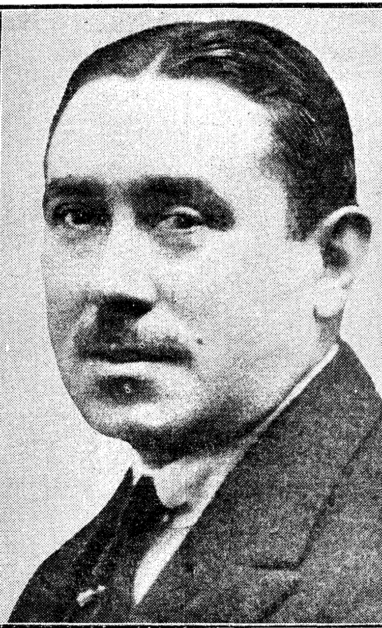
El ilustre maestro compositor don Joaquín Turina, nombrado cátedrático de Composición en el Conservatorio Nacional de Música