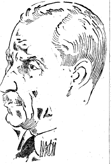
EL SR. MARTIN

ZARAGOZA, 5.—Comunican de Tudela que en aquella estación chocaron el correo del Norte con un mercancías. Resultaron tres heridos leves. No tuvo el choque la importancia que en un principio se creyó. El material sufrió algún desperfecto, pero no llegaron a Zaragoza con tres horas de retraso.