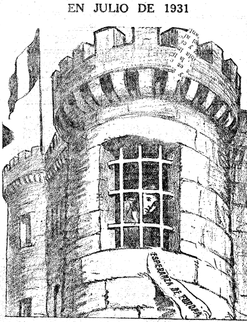
EN LA NUEVA BASTILLA