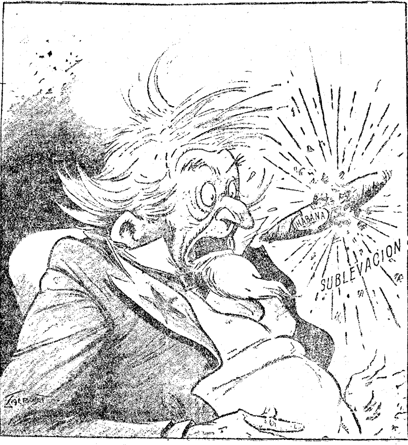
ESTABA CARGADO ("Washington News")