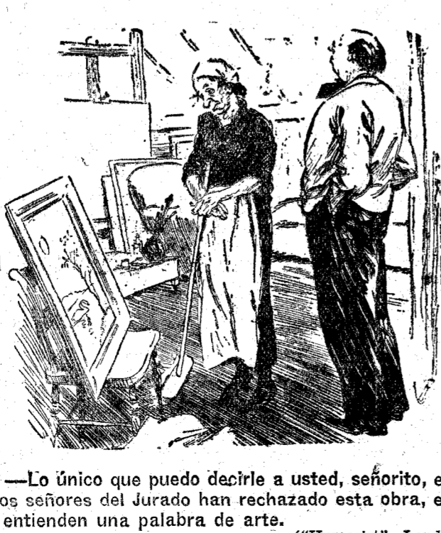
—Lo único que puedo decirle a usted, señorito, es que si los señores del Jurado han rechazado esta obra, es que no entienden una palabra de arte. ("Humorist", Londres.)