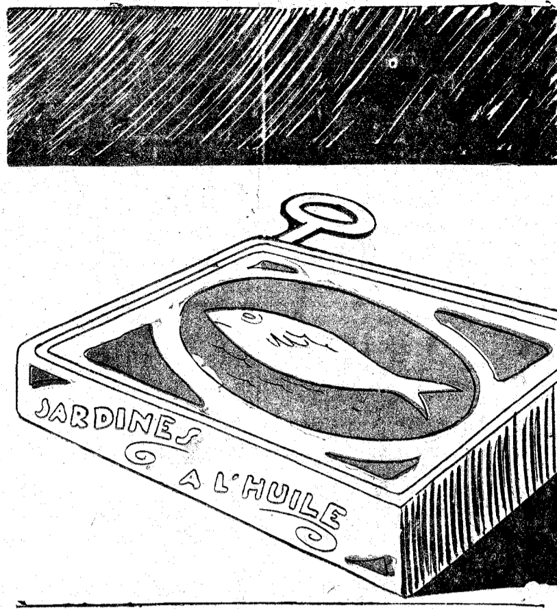
Uno de los establecimientos que más se van a abrir mañana.