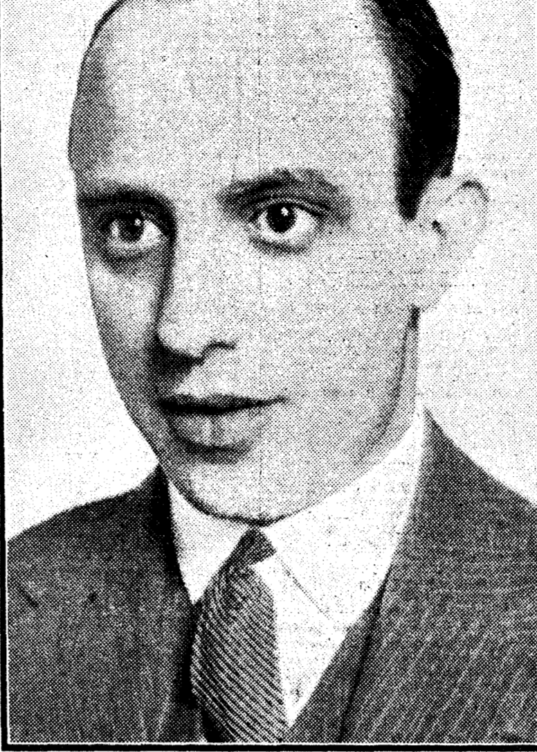
Don Rafael Carrasco Garrorena, astrónomo del Observatorio de Madrid, que ha descubierto un nuevo cometa