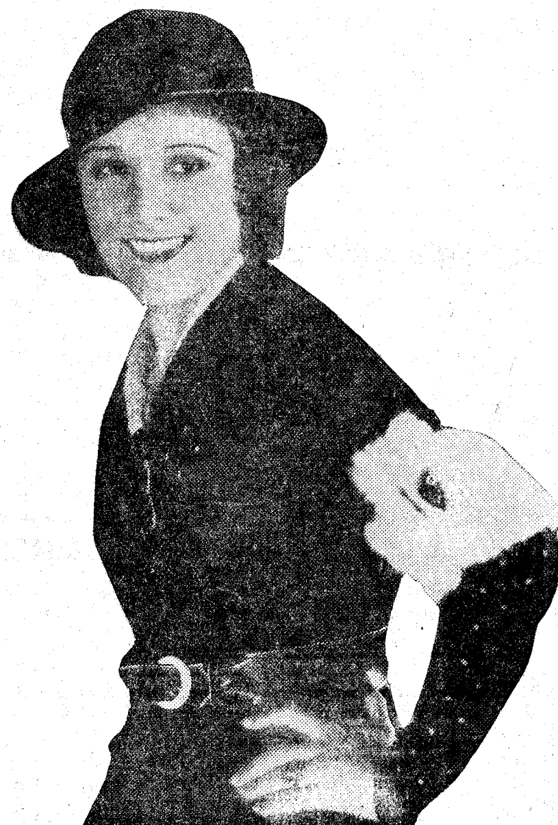
Imperio Argentina, la bellísima actriz cinematográfica, cuyo debut está anunciado en Rialto para el próximo Lunes

En cuanto a mi Conservatorio, fué la calle; mi profesor, el público. Sin embargo, todo esto es una escuela que vale como la más difícil.