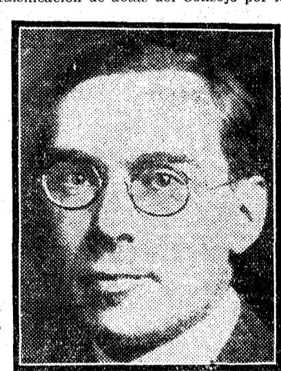
SIR RICHARD SQUIRES, Primer ministro de Terranova.

SAN JUAN DE TERRANOVA.—Una muchedumbre, compuesta de varios miles de personas, ha asaltado el Parlamento, ante el fracaso del Gobierno de abrir una investigación pública para determinar lo sucedido con la supuesta falsificación de actas del Consejo por los