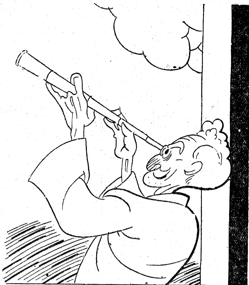
—¿A que va a ser mi mala estrella?