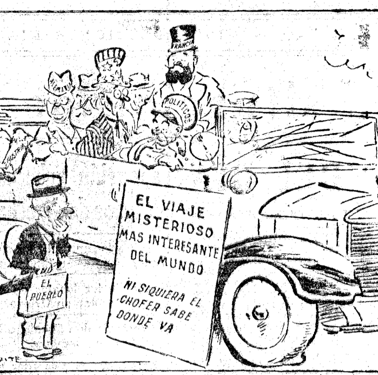
¡SI PUDIERA NO EMBARCARME! ("Glasgow", Record.)