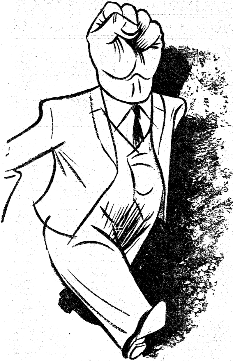
EL HOMBRE DE AHORA ("Nebelspalter", Zurich.)