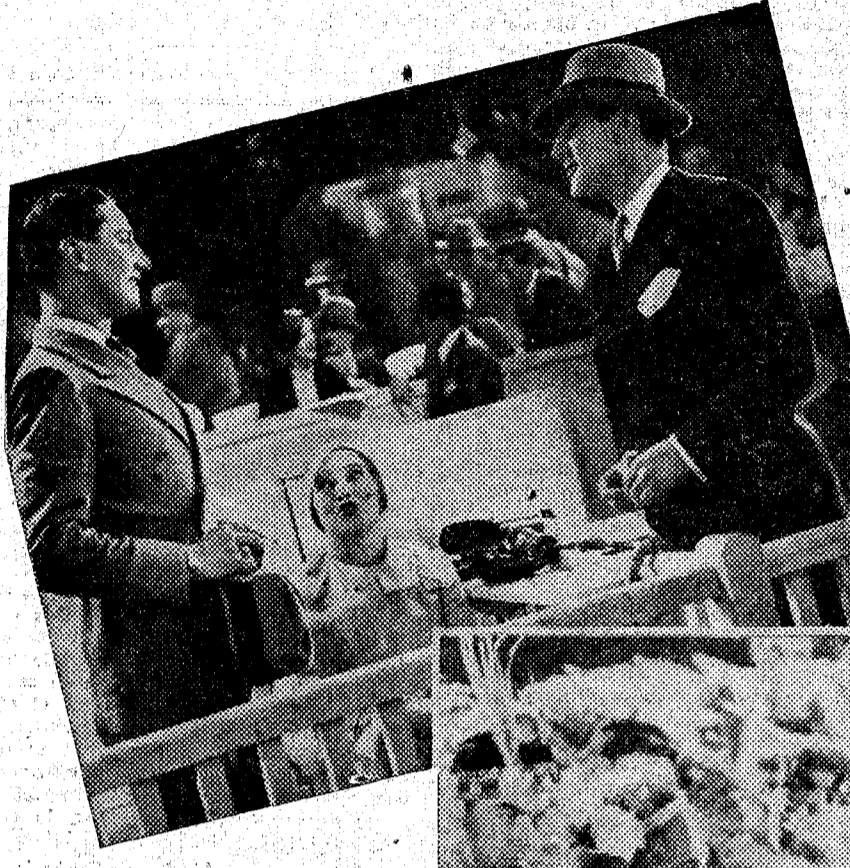
Kate de Nagy y Jean Murat en un momento de la película "El vencedor", que próximamente se estrenará en el Cine de la Opera