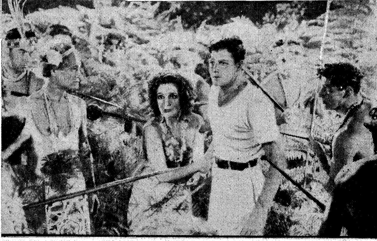
Dolores del Río en "Ave del Paraíso", película maravillosa, esperada con ansiedad por el público, que se estrena el lunes próximo en el aristocrático Callao

El próximo jueves se inaugurará la elegante sala de ACTUALIDADES. Un programa de excepcional interés y originalidad, elegido con escrupuloso cuidado, inicia la vida de este nuevo Cine destinado a ser centro de reunión de todos los entusiastas del "Séptimo Arte". Haciendo honor a su nombre de ACTUALIDADES, desfilará por la pantalla una información mundial debida a los célebres noticiarios Ufa y Eclair Journal las famosas curiosidades "Educarcional Picturas", tendrán una espléndida representación, y el "Mickey Mouse" deliciosamente gracioso con sus dibujos inimitables y en colores llevarán la más sana alegría a sus espectadores.