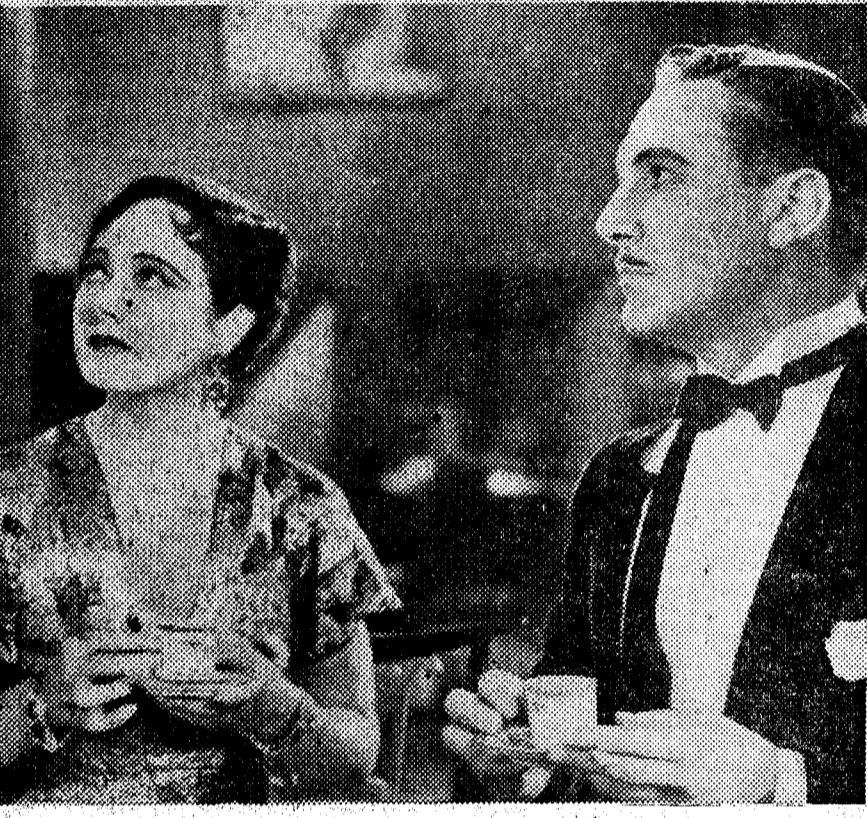
Una escena de "La conquista de papá", "film" Paramount que interpretan Dorothy Jordan y Paul Lukas