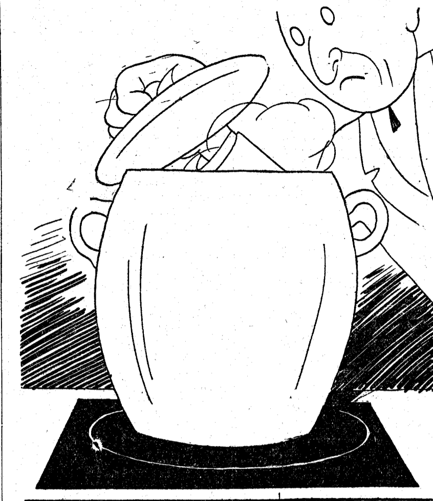
—Ya huele a puchero de enfermo.