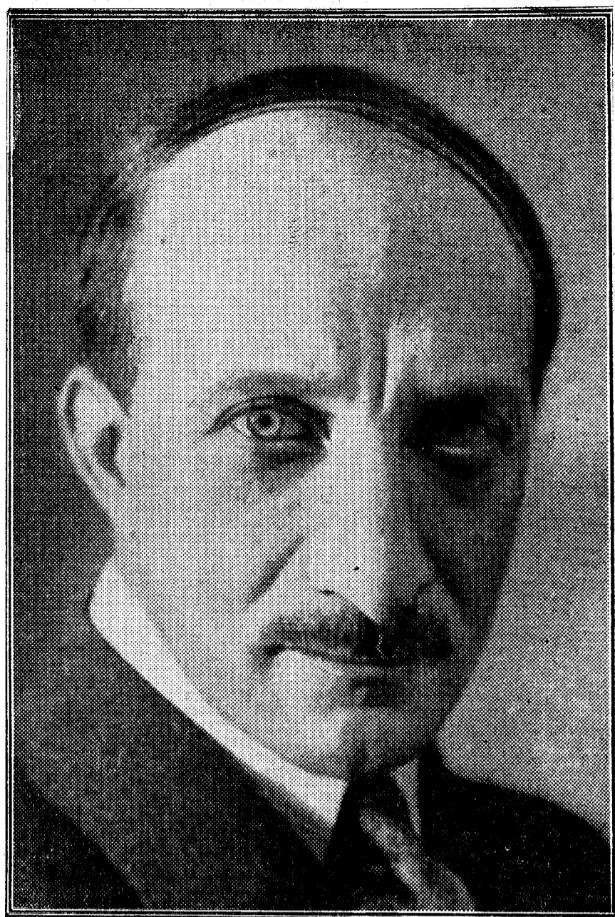
Georges Bonnet, nuevo ministro de Hacienda de Francia

rumores, en la mayoría.) ¡Así hay que aceptar las desgracias, con la sonrisa en los labios!