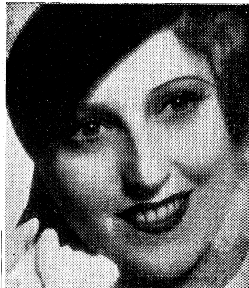
La belleza fresca y sonriente de Jeanette Macdonald y el encanto de su voz maravillosa vuelven a sugestionar al público en Astoria, interpretando el papel protagonista de "Amame esta noche"