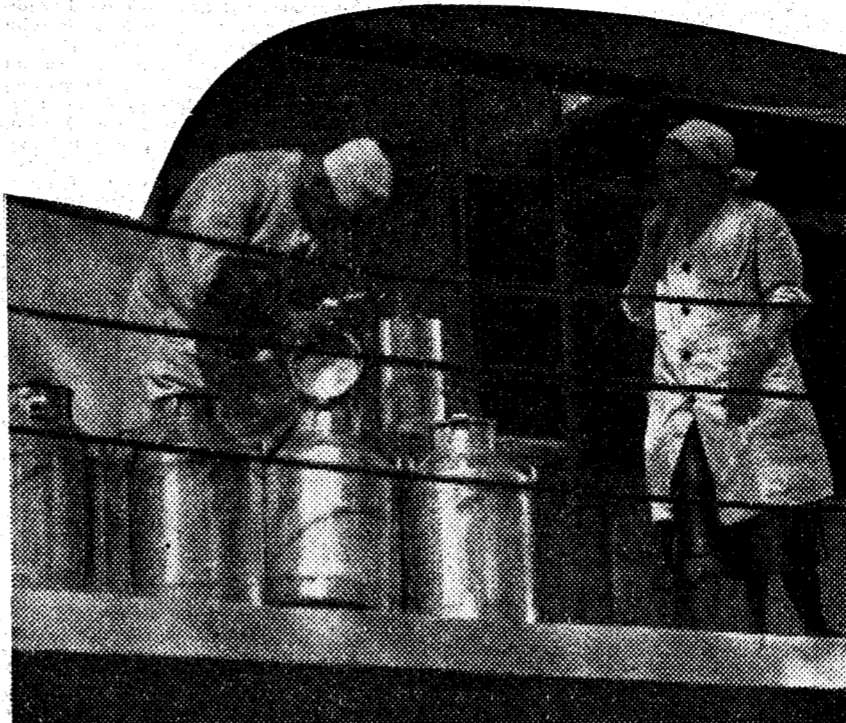
Una escena del "film" "La línea general", que se estrenará pronto