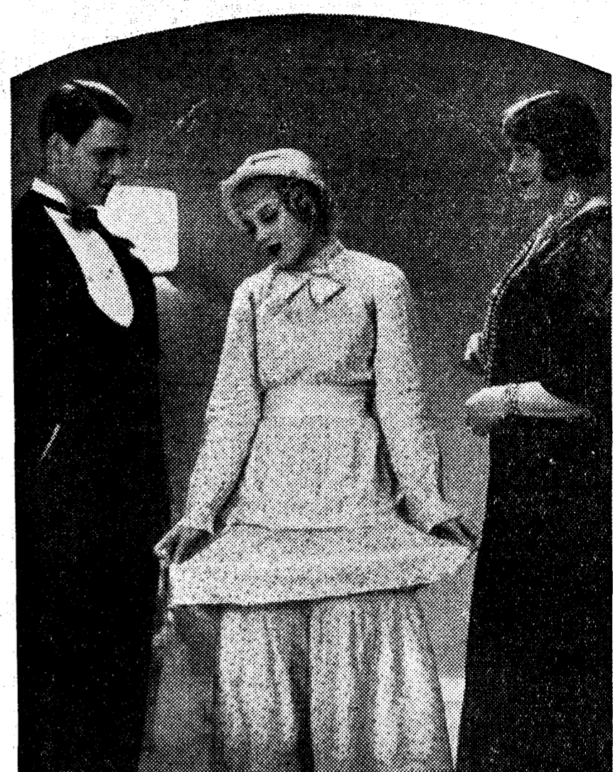
Una escena de la comedia "Hay que casarlos", que el lunes estrena el aristocrático Callao