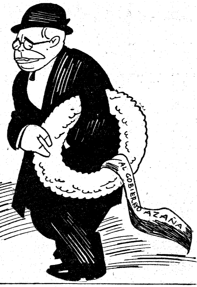
¿Con el estreno de la corona?