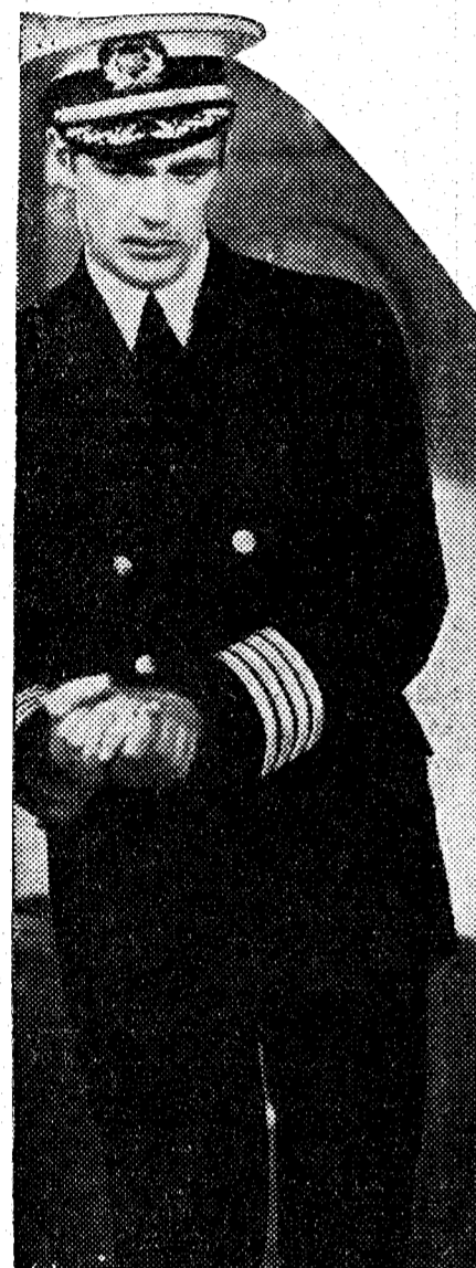
Gary Cooper y Claudette Colbert en "Una mujer a bordo", que el lunes se estrena en la Prensa