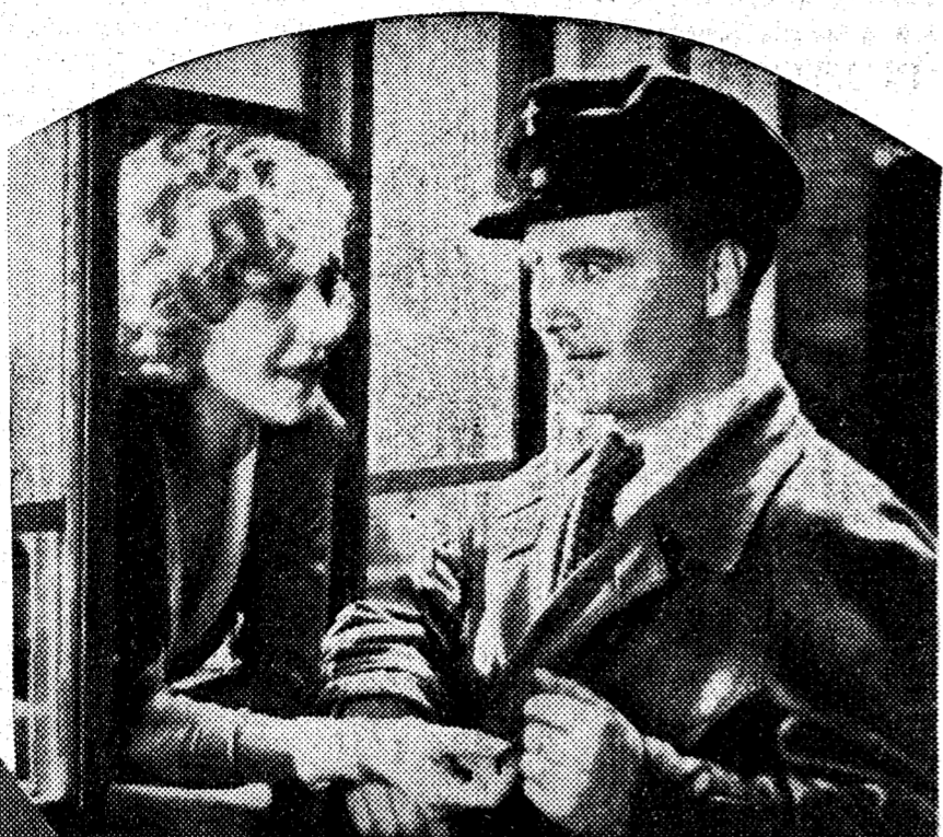
Una escena de la graciosa comedia de la Aafa "Te quiero, Anita", interpretada por Marta Eggerth, que en breve se estrenará en Madrid

Con una prueba privada se inauguró anoche el "cine" instalado en el Circolo de Bellas Artes, local moderno, elegante y con cuantas comodidades puede exigir el público. La espaciosa sala está instalada en la planta baja del Circolo, sus localidades son muy cómodas, está decorado con gusto y elegancia, predominando los tonos claros, que le dan un aspecto muy agradable. Seguramente será uno de los preferidos de nuestro público, a poco que cuiden los programas.