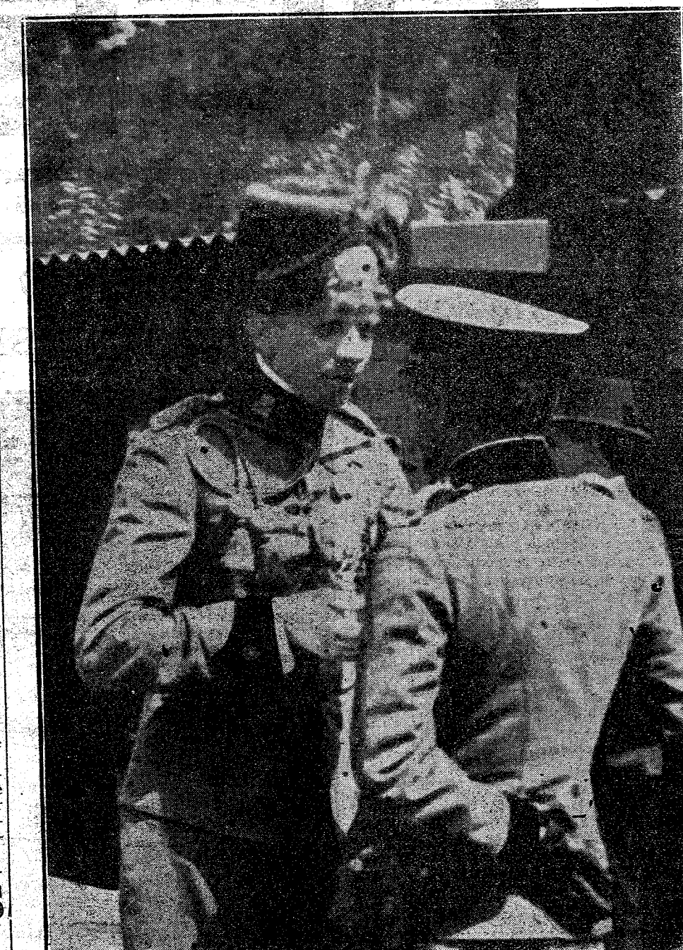
EL INFANTE DON FERNANDO, QUE HA SALIDO PARA LA GUERRA FORMANDO PARTE DEL REGIMIENTO DE LUSITANIA