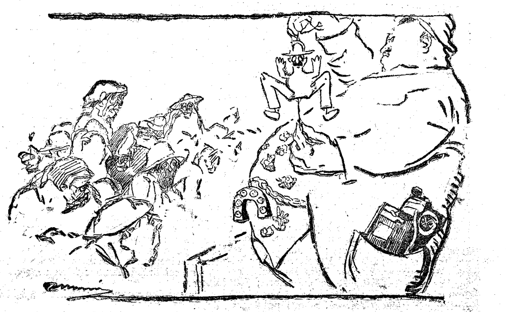
EN LA DE LA CASA DEL PUEBLO