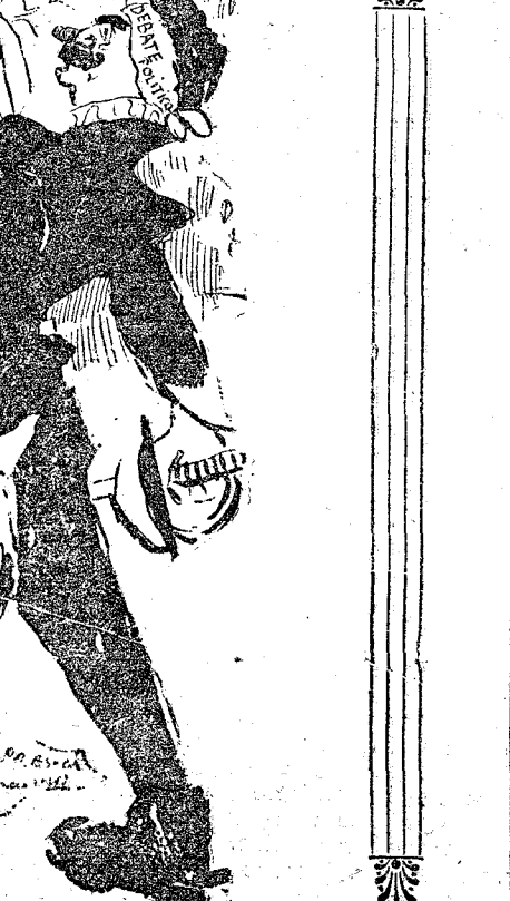
(Delirando).—¡A mí los conjurados! ¡Ay de mis zancadas de la Gascañal!