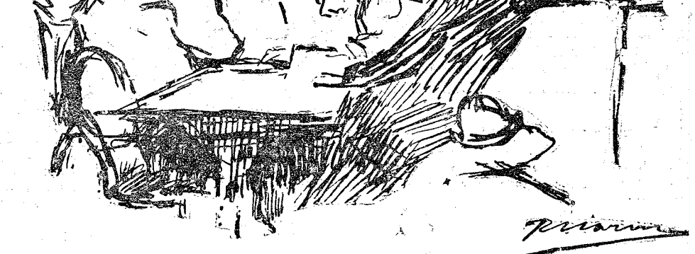
El insigne orador tradicionalista señor Vázquez de Mella en su tertulia del Suizo.