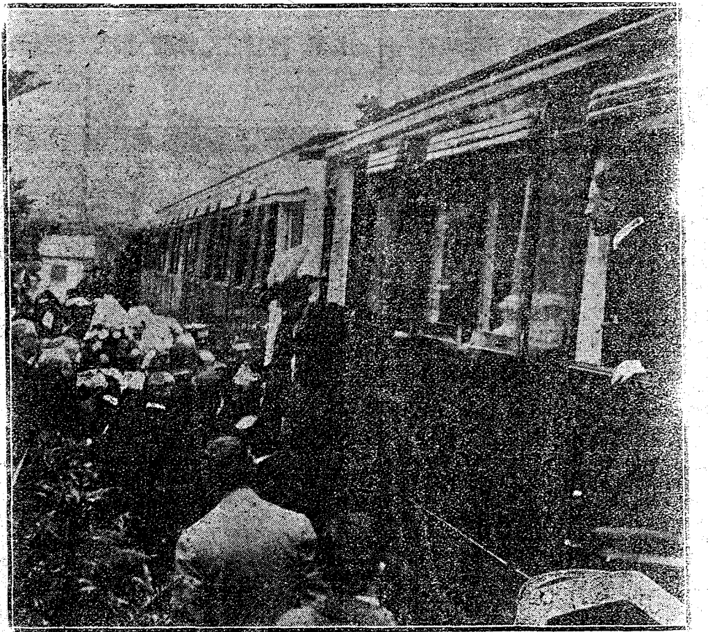
S. M. LA REINA DESCENDIENDO DEL TREN A SU LLEGADA A ALICANTE

FOR TELÉGRAFO (DE NUESTRO SERVICIO EXCLUSIVO)