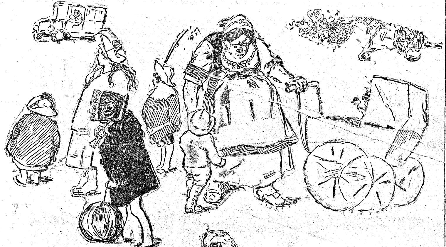
UNO DE LOS NIÑOS.—Mirad