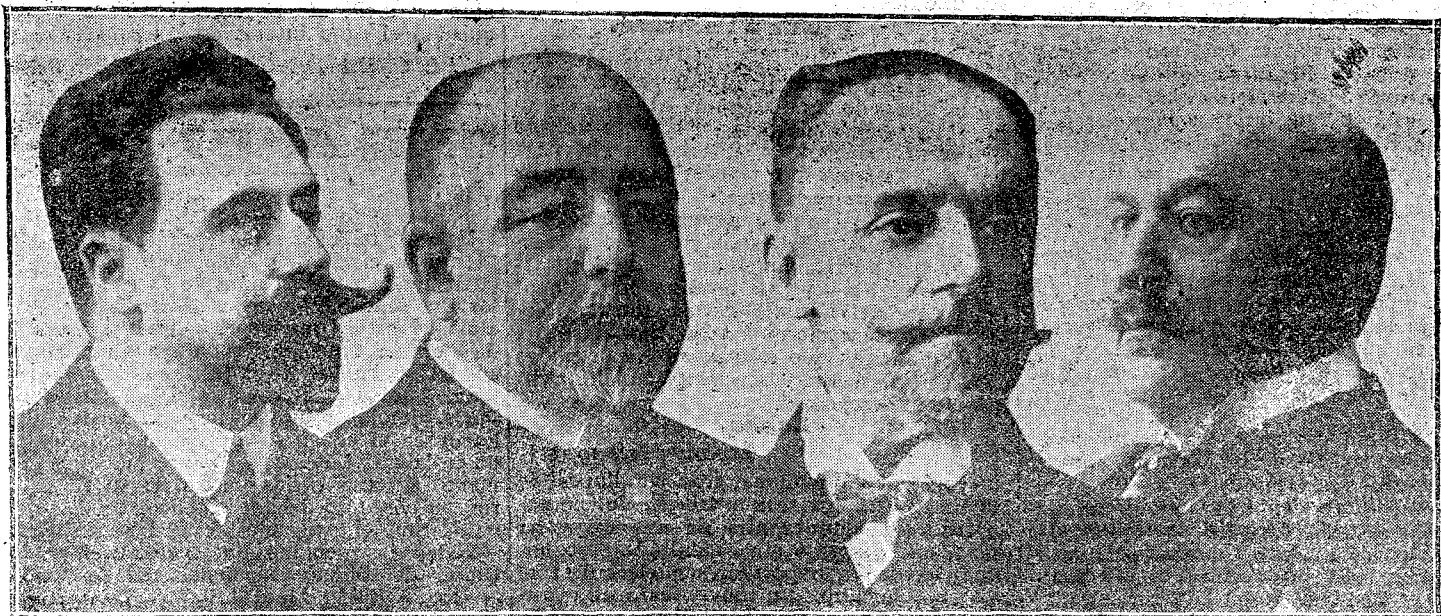
DON SANTIAGO ALBA, Don Diego Arias de Miranda, Don Miguel Villanueva, Don Juan Navarro Reverter, Instrucción pública, de Gracia y Justicia, de Fomento, de Hacienda.