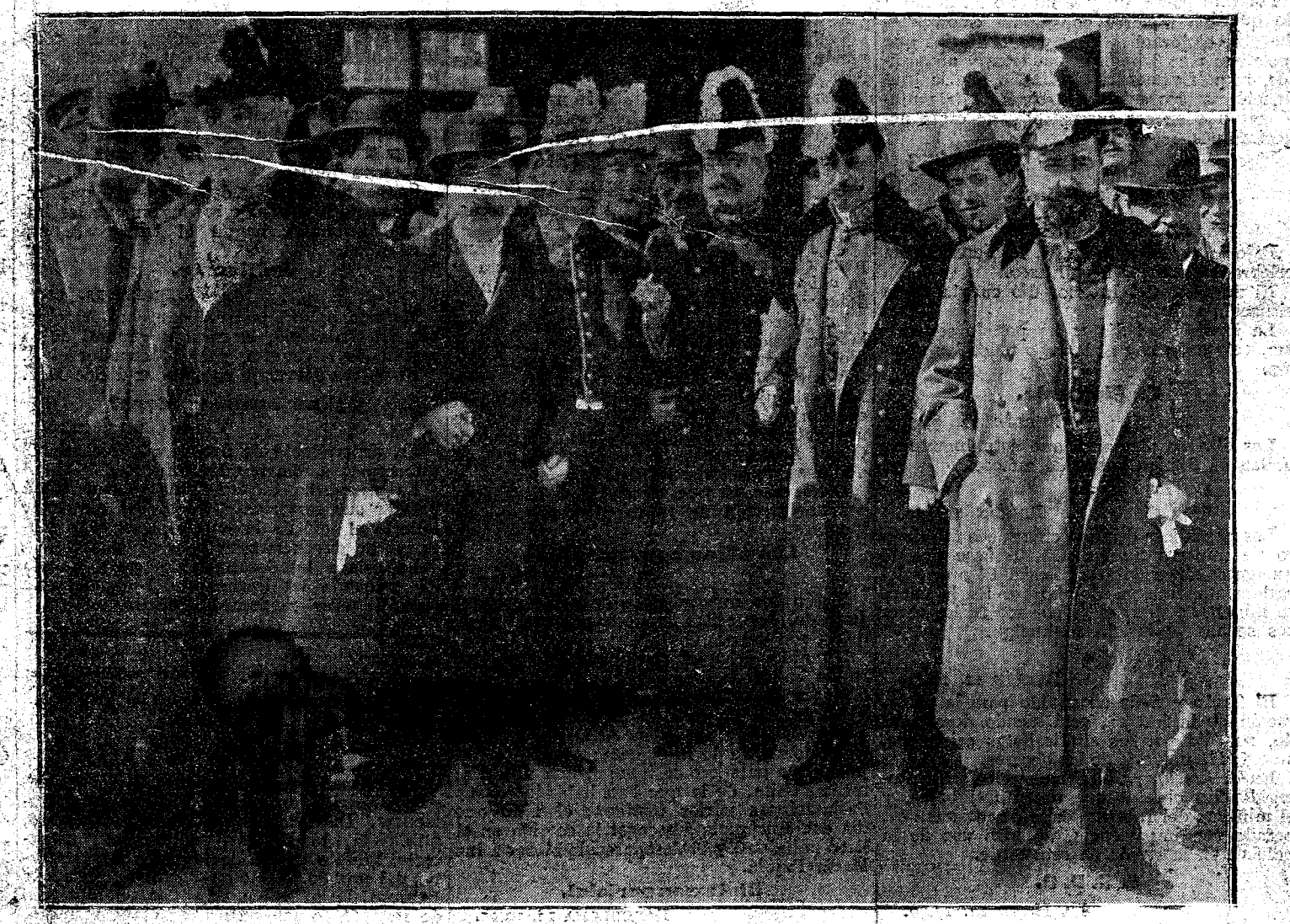
LOS MINISTROS SALIENDO DE PALACIO AYER MAÑANA, DESPUÉS DE HABER PRESTADO JURAMENTO

Estas eran las enseñanzas que recibían los niños en la Escuela Moderna.