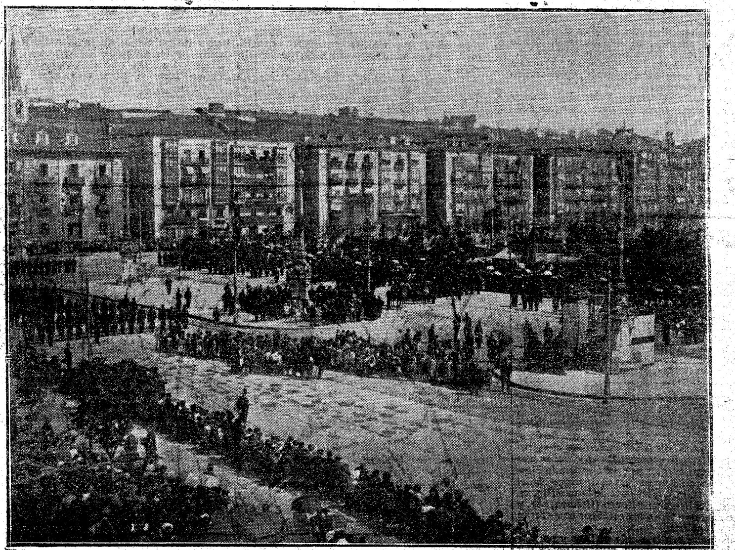
SANTANDER.—JURA DE LA BANDERA. Durante la mita en el pascó de Pereda.

Publicados ó no, no se devuelven originales, los que envían original sin contratar antes con la Empresa del periódico, se entienden que suplican la inserción gratis.