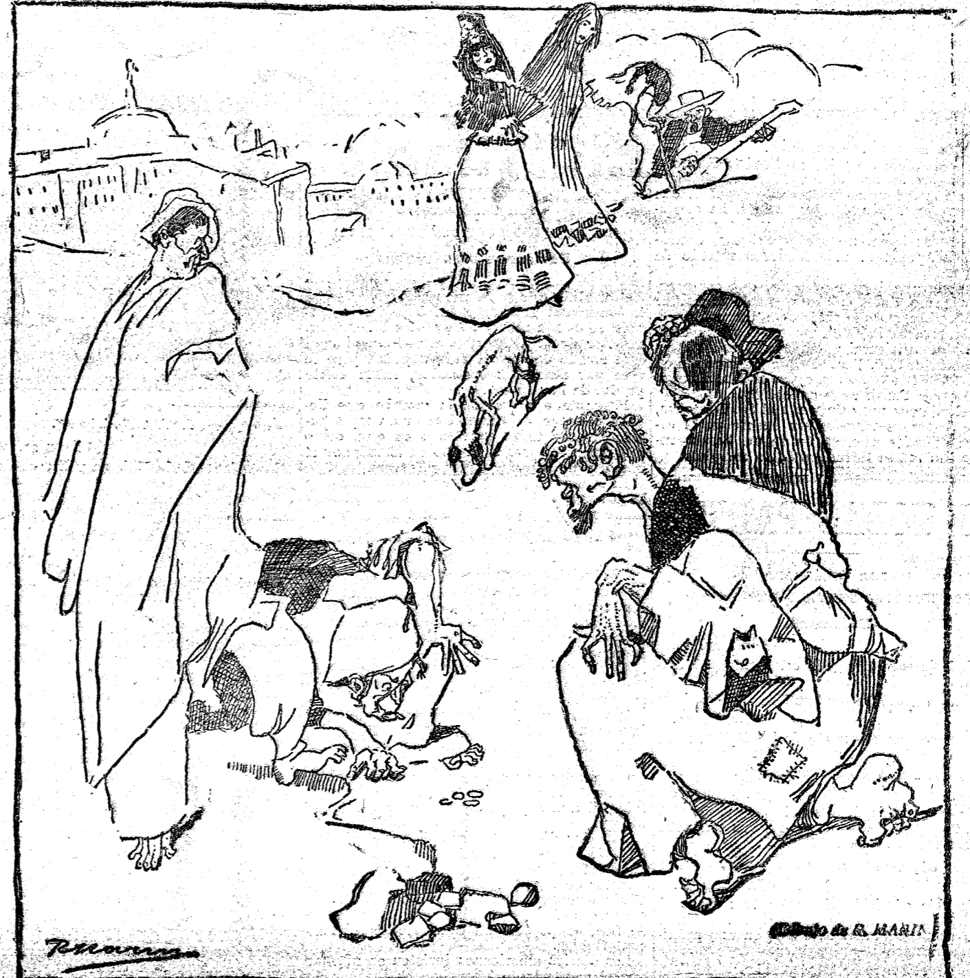
Y dicen las mujeres madrileñas, inspiradoras de las coplas: Si tuvierais un orfeón donde expansionar vuestros espíritus, no os dominaría el vicio y la pobreza.