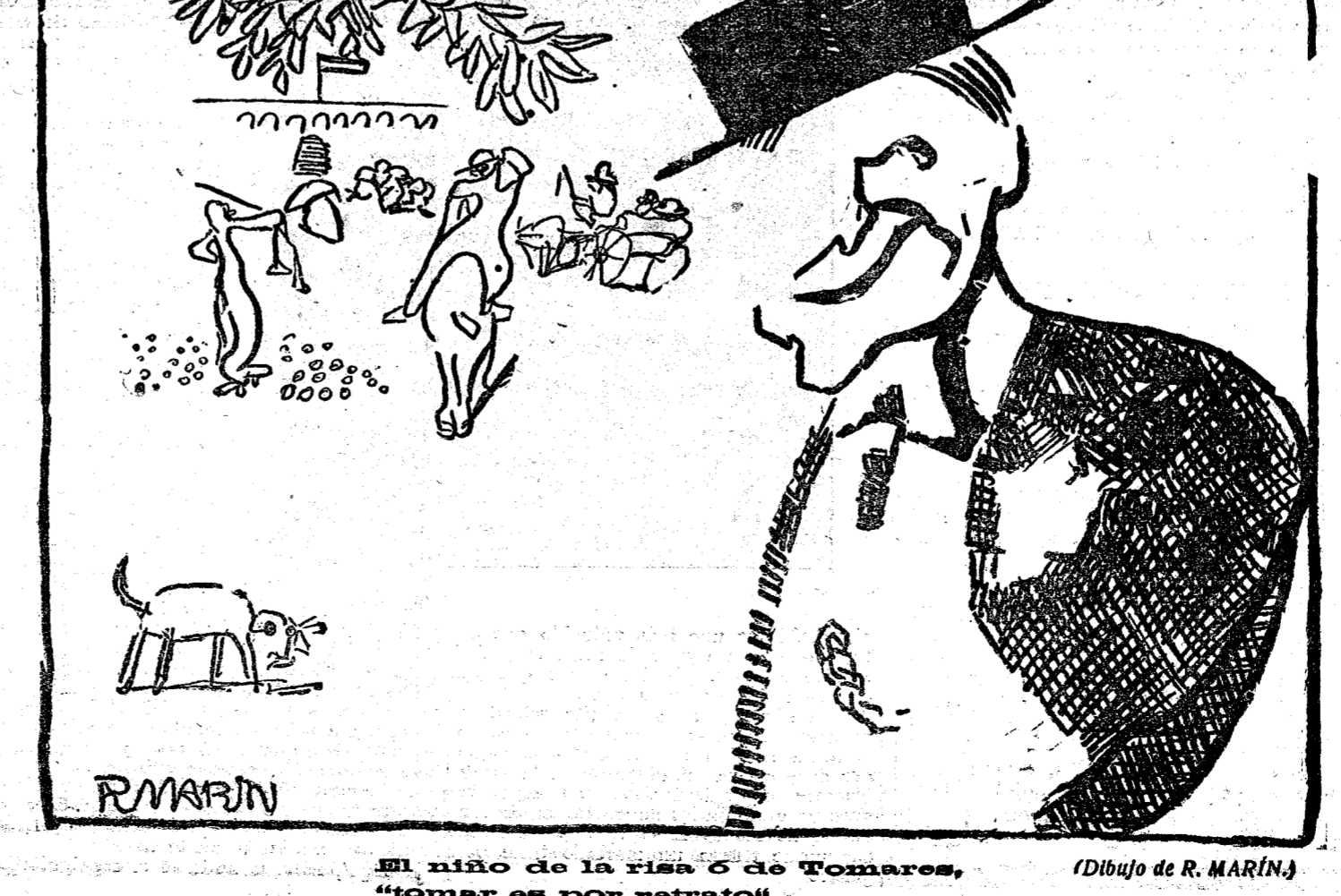
El niño de la risa o de Tomares, (Dibujo de R. MARÍN)

Al terminar la reunión, el doctor Recasens y su amable esposa obsequiaron a los reunidos con una copa de Champagne, haciendo votos para que esta visita sea, a más de la difusión del arte, unión de los españoles.