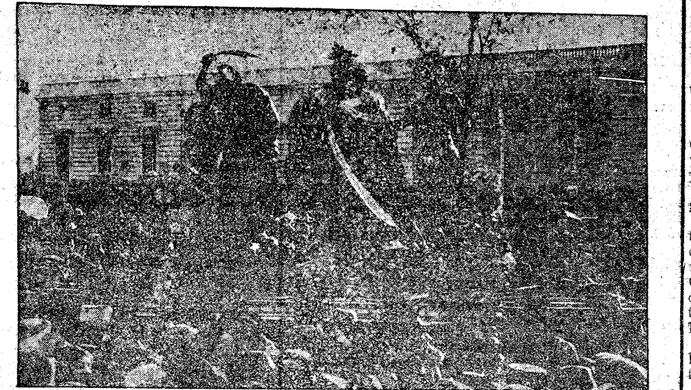
De la procesión del Santo Entierro celebrada ayer en Madrid. Uno de los Pasos, en la Plaza de la Armería.