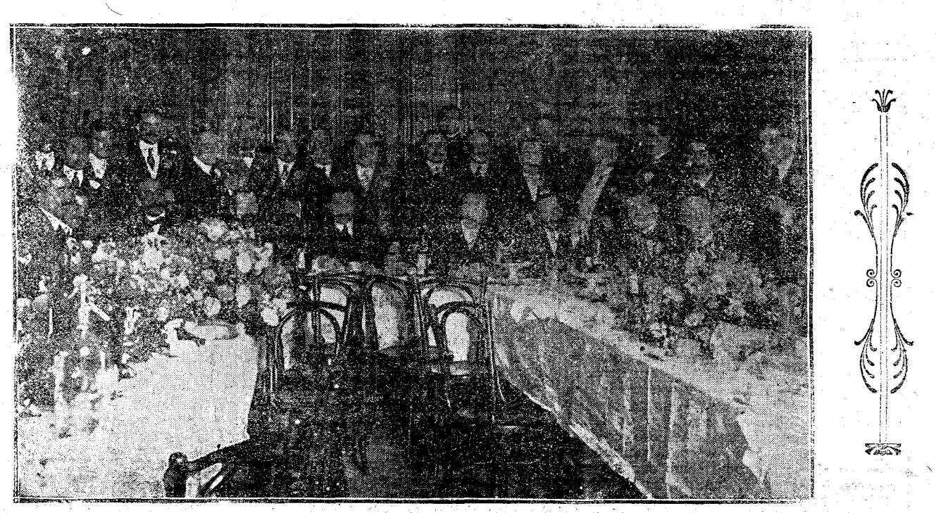
MADRID.—INAUGURACIÓN DEL CASINO DE LEVANTE

En la estación del Mediodía se reunieron toda la familia real y numerosa representación de los elementos oficiales y palatinos, que tributaron al Monarca una afectuosa despedida.