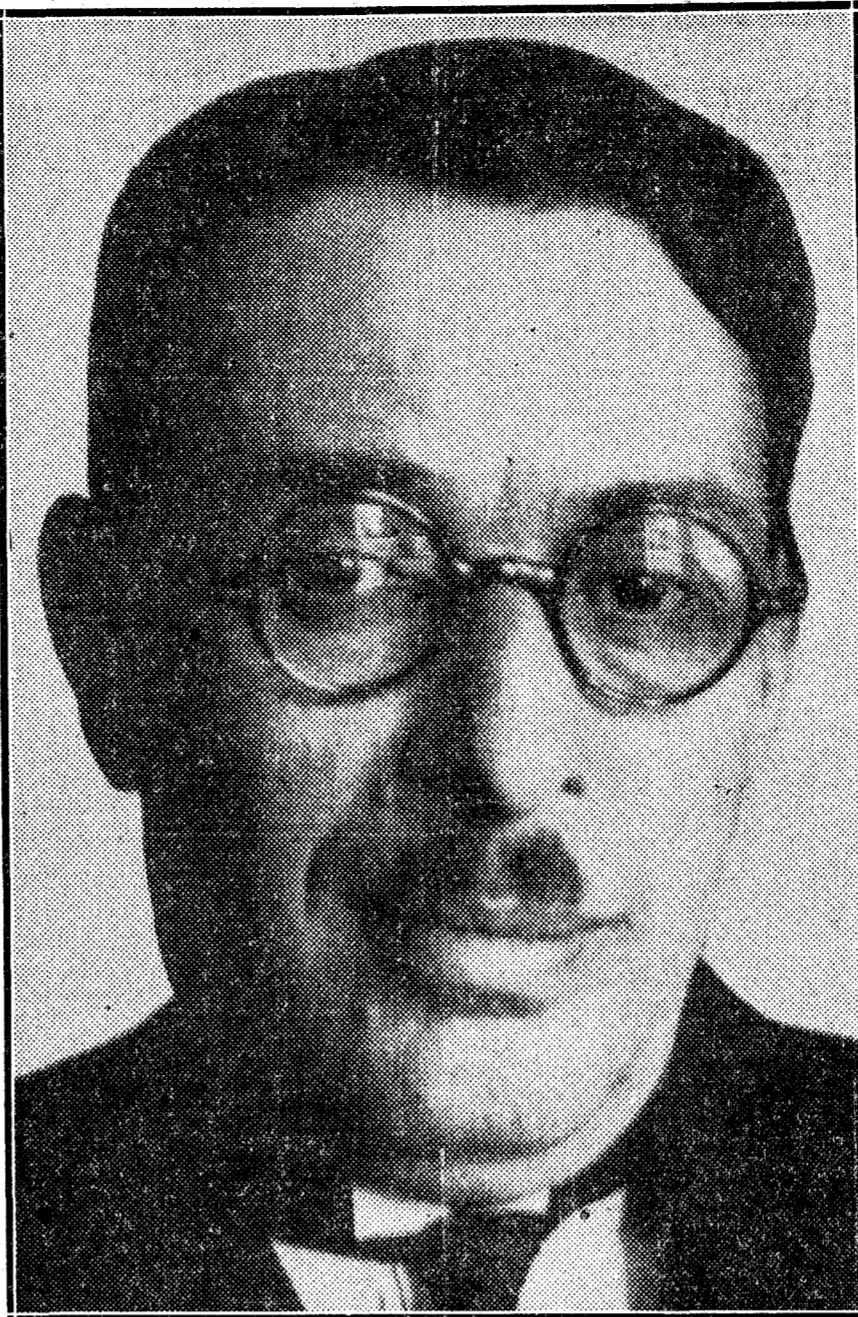
Don Eduardo Santos, embajador extraordinario de Colombia, que ha presentado sus cartas credenciales