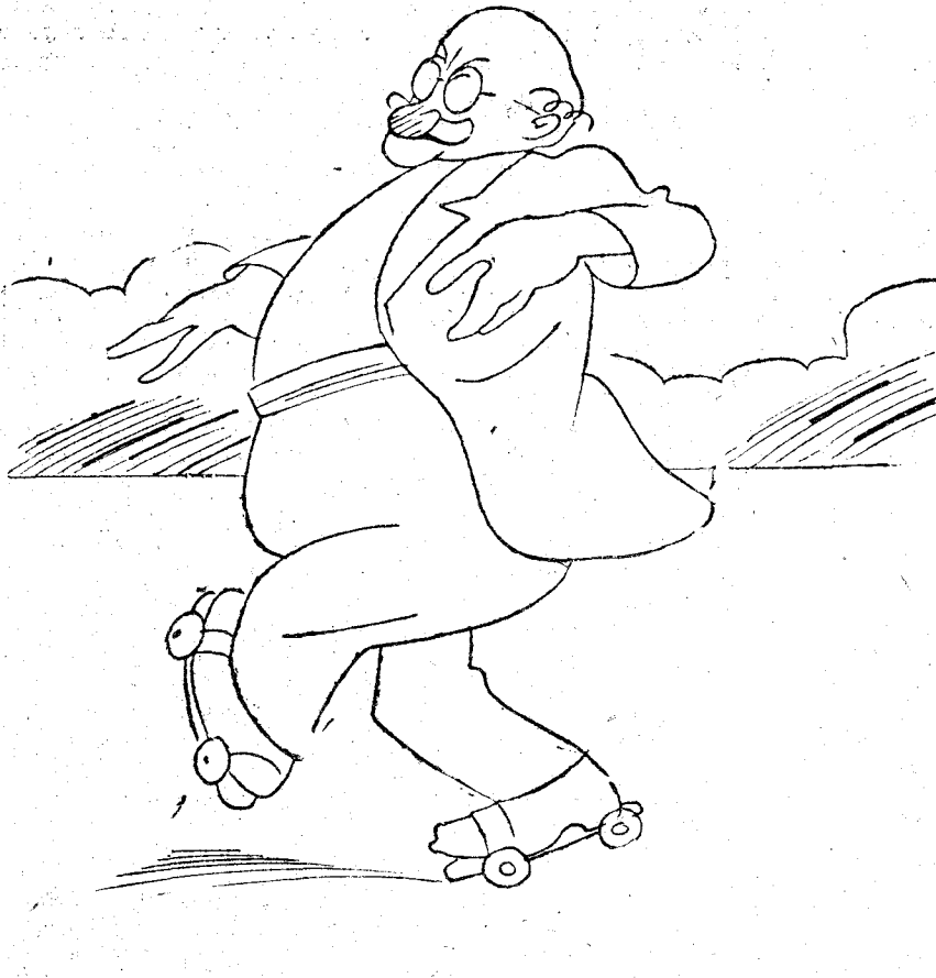
Con estas vueltas tan rápidas no puede seguirme nadie.