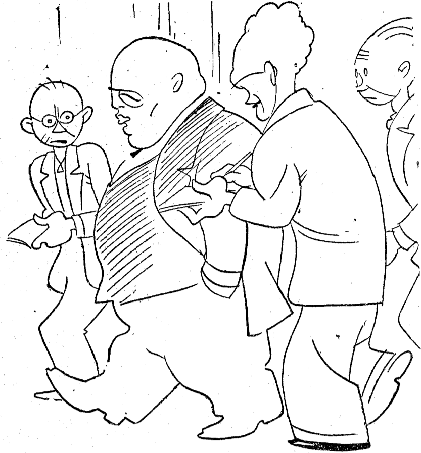
—Al menos, don Inda, ¿puede usted decirnos quién vendrá después de usted? —Después de mí... el diluvio.