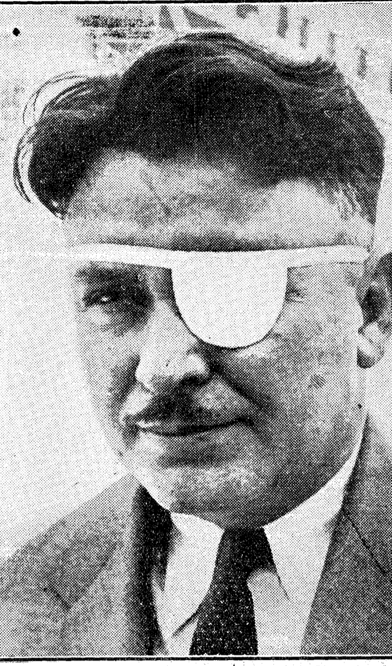
El aviador yanqui Wiley Post, que ha dado la vuelta al mundo en siete días