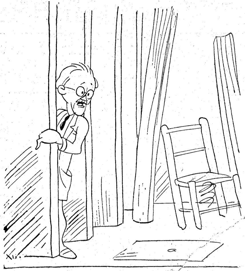
FRANCHY.—¡Vaya un papelito que estoy representando!