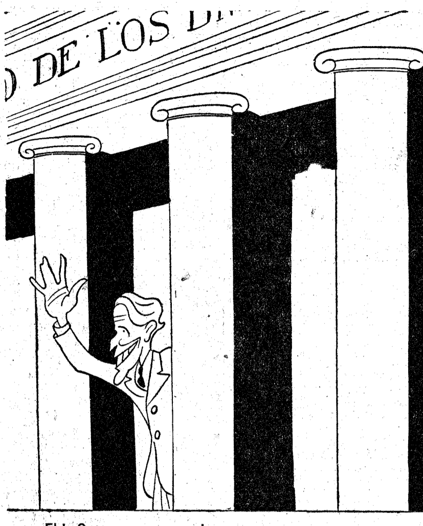
—¡Eh! ¡Que se va a cerrar!