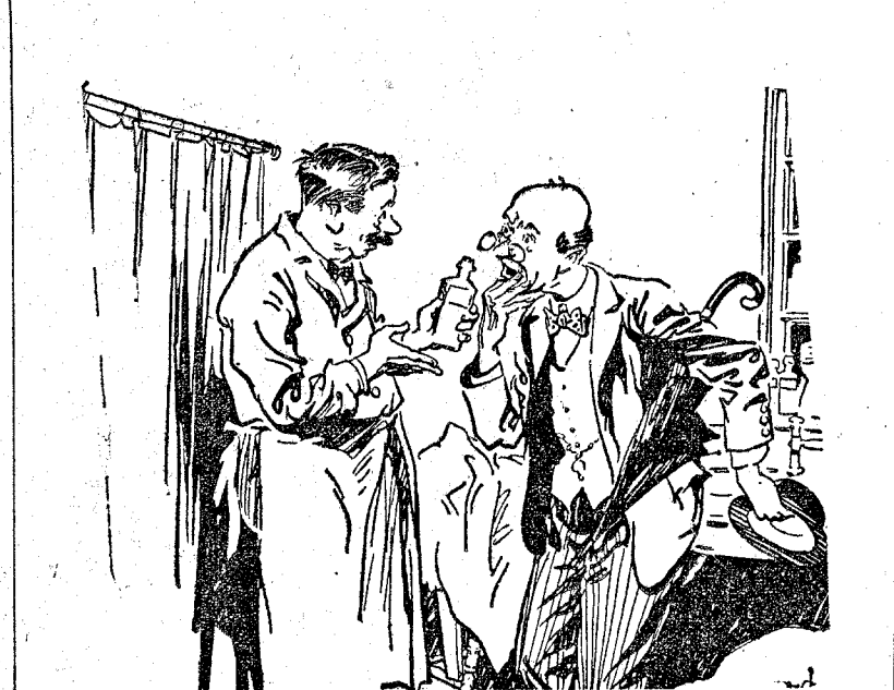
—Aquí tiene usted este gran específico contra la calvicie. No se lo ponga usted hasta que llegue a casa, para que la gente no le vea crecer el pelo oor la calle. ("Everybody's", Londres.)