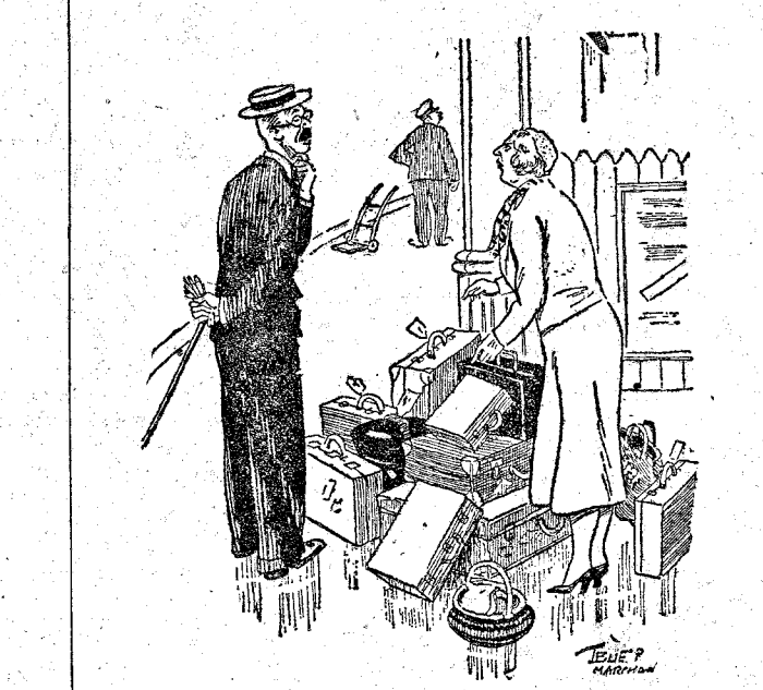
—Aquí no hay más que doce bultos y habíamos hecho trece. —Sí, querida; es que soy algo supersticioso, y me he dejado intencionadamente el que pesaba más.