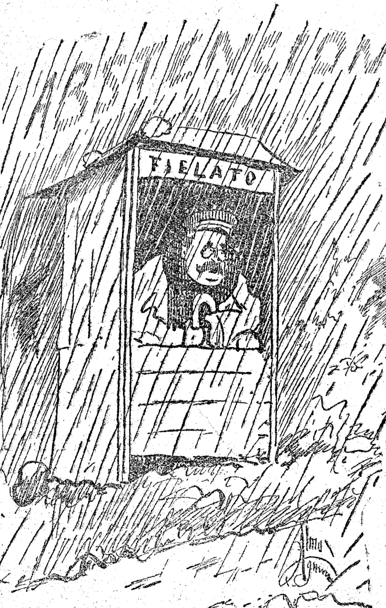
Esto es sólo un chaparrón de verano. Me parece que pasa la tormenta.