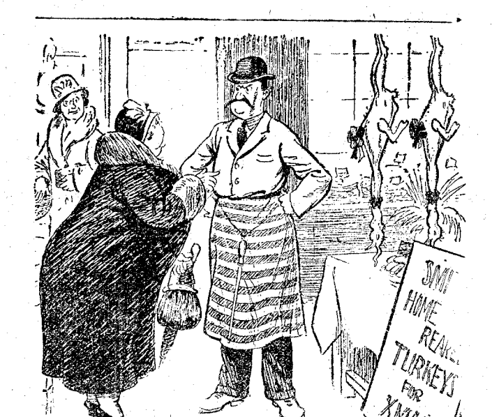
—¿Quiere usted decirme lo que le da de comer a sus pollos? Debe de ser magnifico para adelgazar.

Entre nosotros no habrá nadie que se (Continúa al final de la primera columna de la tercera plana.)