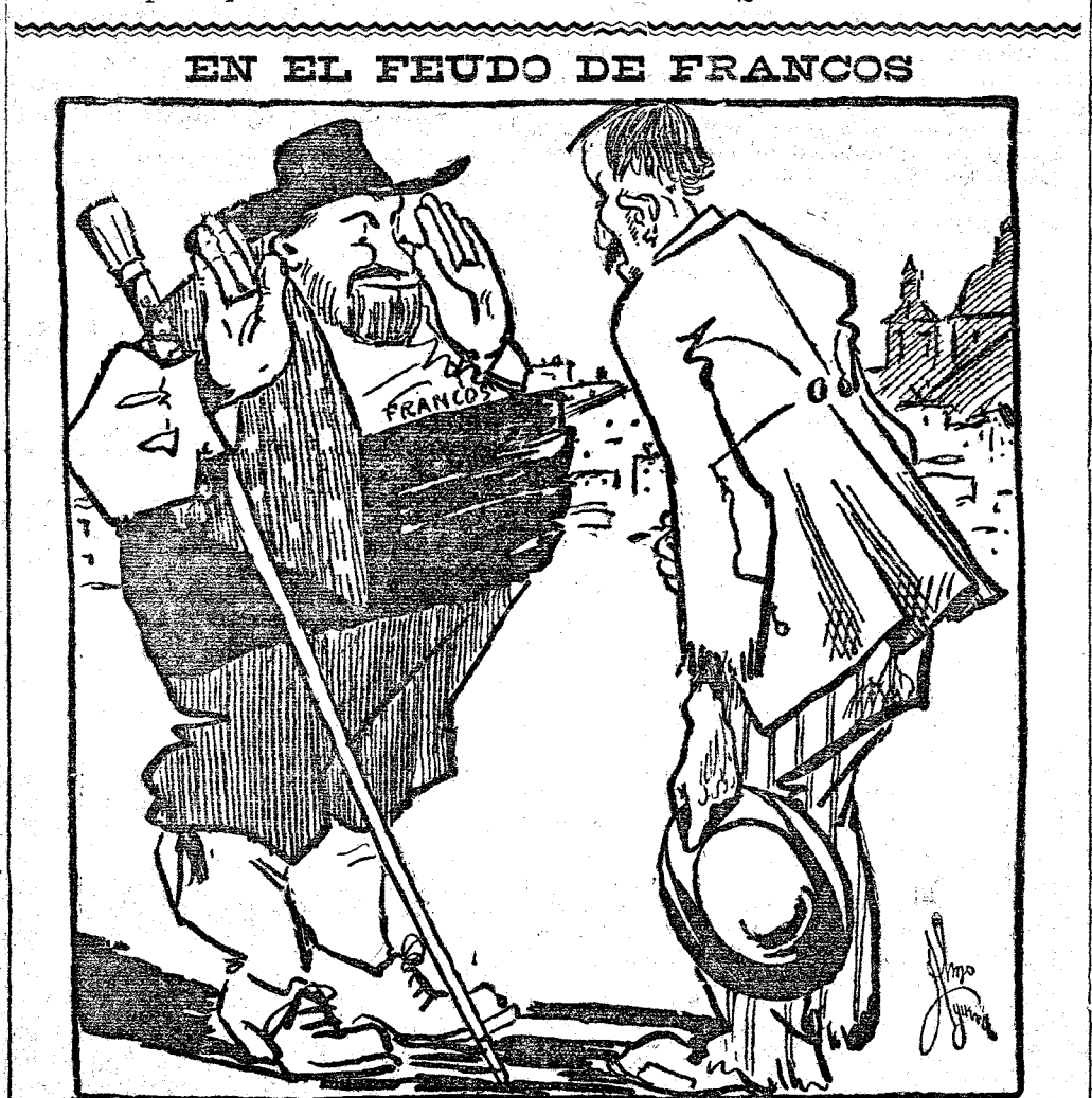
ALCALDE. . . — Paciencia, paciencia; ya les haré bajar los humos. CIUDADANO. — ¿Y los precios?

El Sr. Canalejas ha recibido una carta del secretario de Su Santidad, Sr. Merry del Val, felicitándole por el brillante resultado del Congreso Eucarístico y cooperación prestada al mismo por el Gobierno