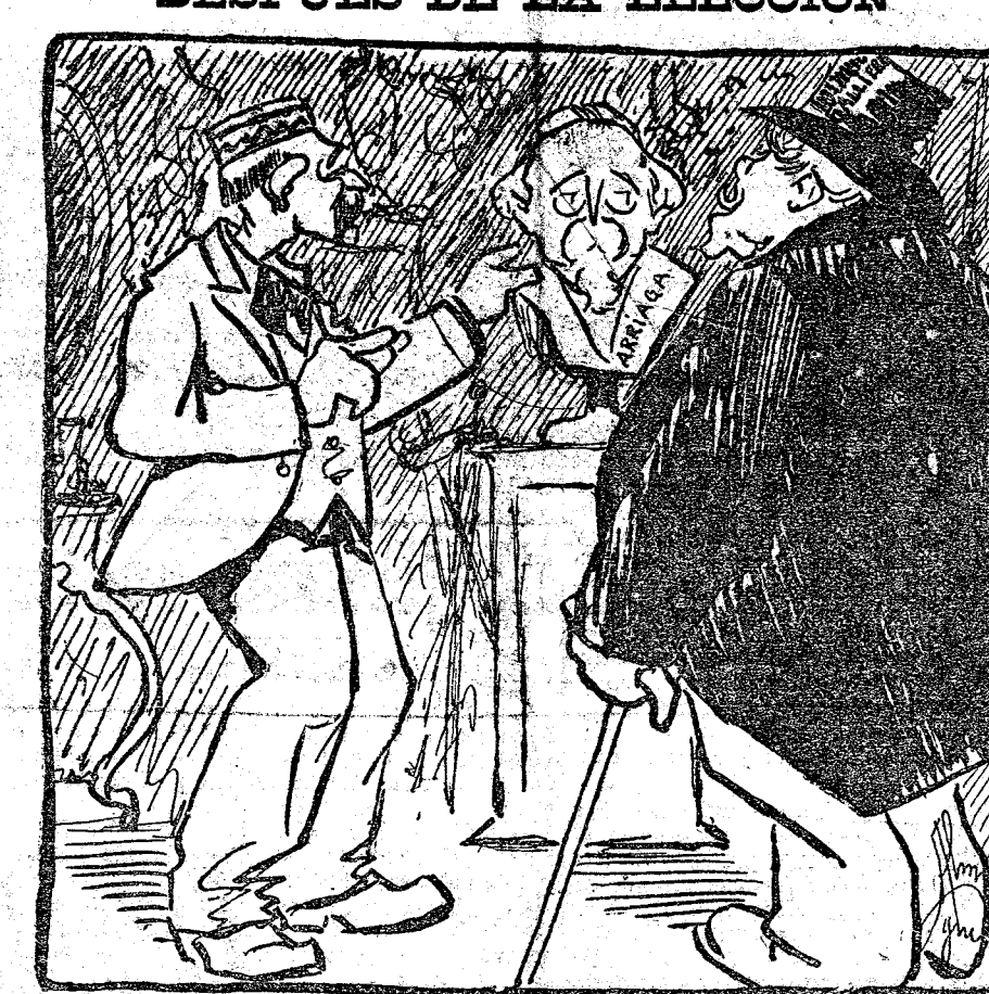
FALLIERES (al escultor).—La cabeza no le ha salido mal del todo. ¡Lástima que sea de piedra!