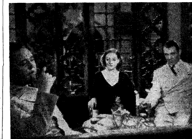
Tallulah Bankhead y Gary Cooper en el "film" "Entre la espada y la pared", que se proyectará desde el lunes en el Cine de la Opera