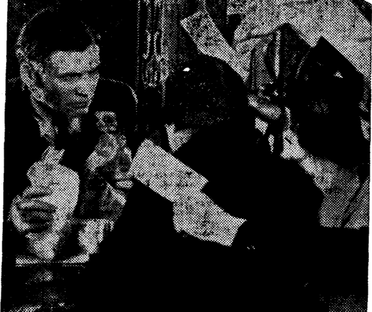
Una escena de "La locura del dólar", emocionante "film" que el próximo lunes se estrena en Astoria

de todo tiene este graciosísimo suceso, que en la pantalla adquiere mayor movilidad y más amplio desenvolvimiento, para regocijo del espectador. La risa surge en la primera escena y ya no cesa hasta el final, en progresión creciente.