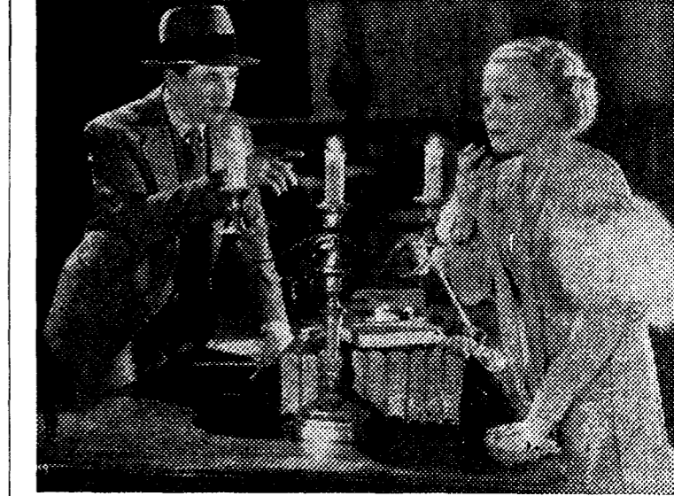
"El crimen del siglo", intrigante "film" que se estrenará el lunes en el Cine de la Prensa