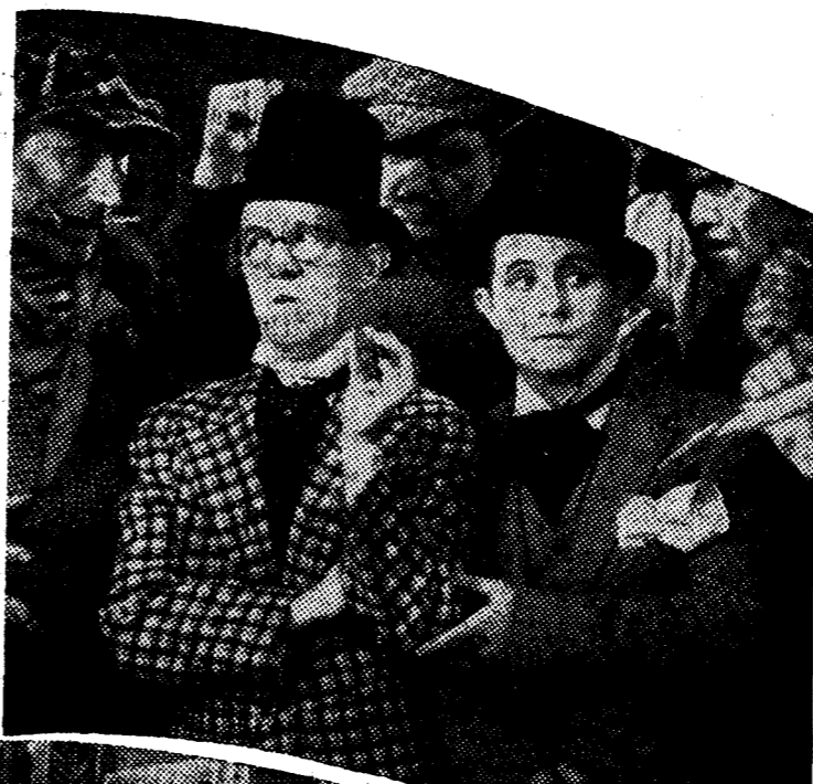
Un momento de la graciosísima película "Diplomancias", que se estrena el lunes en el Avenida