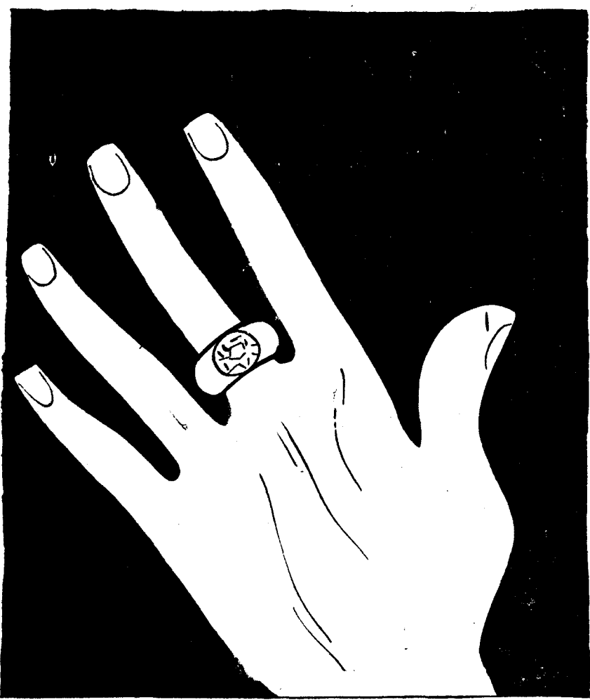
—¡Ya no deslumbró ni a la familia!