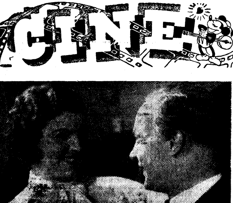
Una escena de «Luchas de sexos», que el lunes próximo se estrenará en el Cine Avenida

(Este periódico se publica con ocasión de la festividad de San Blas)