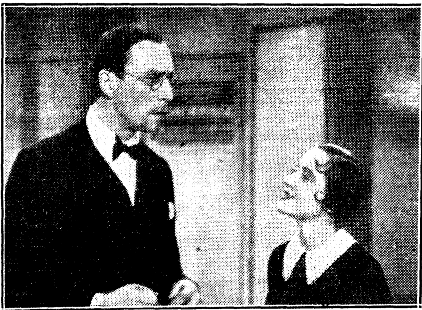
El gran actor Louis Jouvet Pauley en su creación de "Topaze", la formidable comedia que presenta pasado mañana lunes el Cine PROYECCIONES.