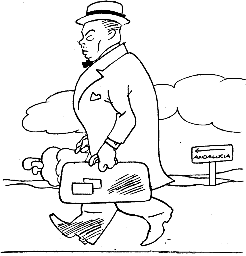
"Sevilla, presidencia del Consejo, cuán atormentais mi mente."