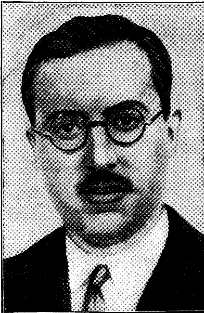
Don Alfredo Zabala, abogado del Estado, nuevo gobernador del Banco de España

PARIS, 9.—El «Petit Journal» escribe: «España se debate entre dificultades económicas y sociales tales, que el menor chispazo puede encender el incendio revolucionario. Al problema catalán viene a añadirse el vasco, cuyo estatuto, que se discutirá en breve, ha de encontrar gran oposición.» El periódico termina diciendo que la labor del Gobierno Latorre es ardua.