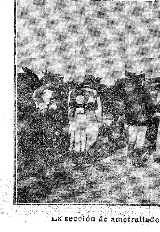
La sección de ametralladoras embarcando el ganado.