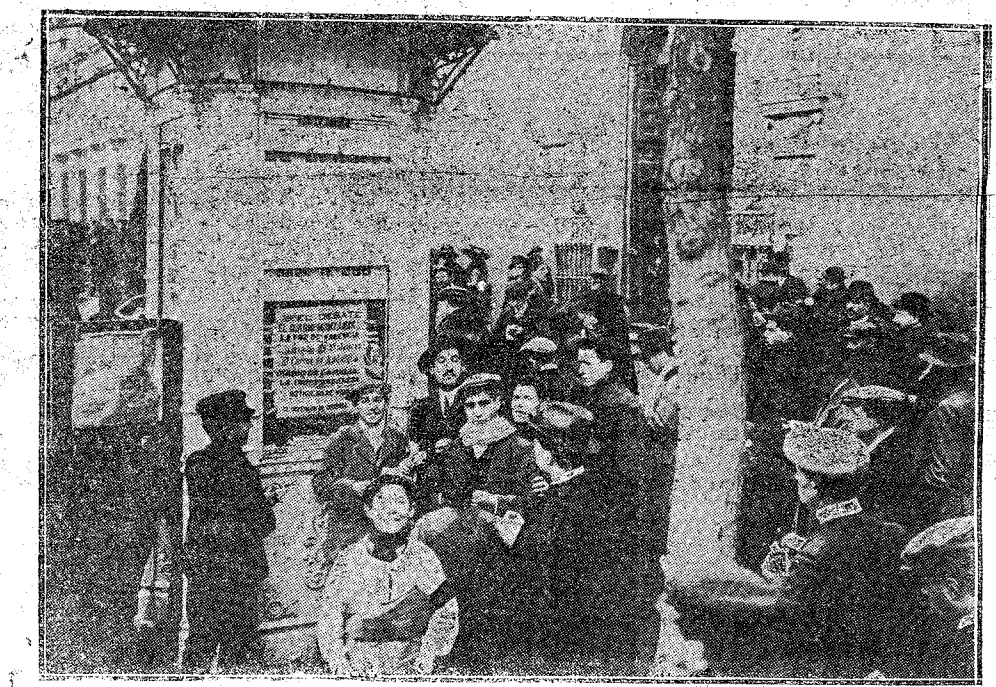
El público leyendo los números premiados en el kiosco de EL DEBATE, de la calle de Alcalá.

tro provincias; éstos, a reclamar protección para sus trigos, que no pueden competir con los extranjeros.