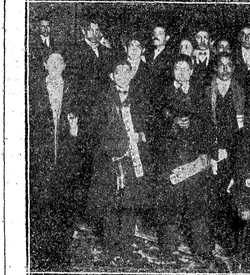
PARANINFO DE LA UNIVERSIDAD. - Los alumnos premiados de la Asociación general de ferroviarios.