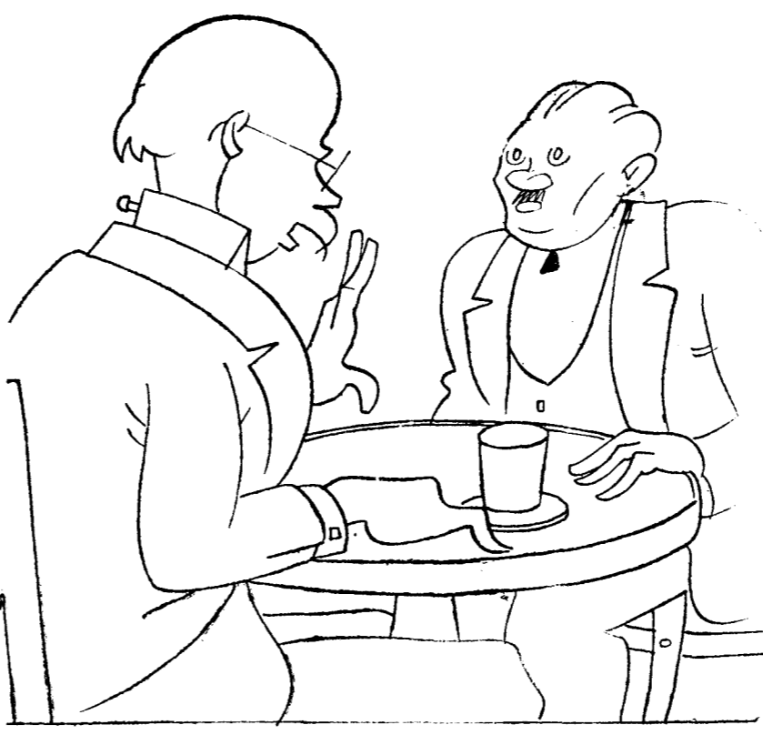
-Pero hombre, ¿le parece a usted poco gracioso venir con un acta después de tanto tiempo? -No importa; hay que estudiarla bien. A lo mejor es el acta de nacimiento.