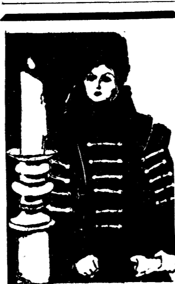
Robert Lynen, el mejor niño-actor del mundo, en "El pequeño rey", superproducción Fil-mófono que el lunes se estrena en CAPITOL

GRETA GARBO en LA REINA CRISTINA DE SUECIA "Film" Metro G. Mayer con JOHN GILBERT y LEWIS STONE HOY ESTRENO