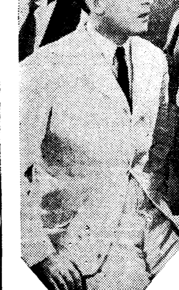
Harold Lloyd triunfa a diario en el CALLAO en "La garra del gato"