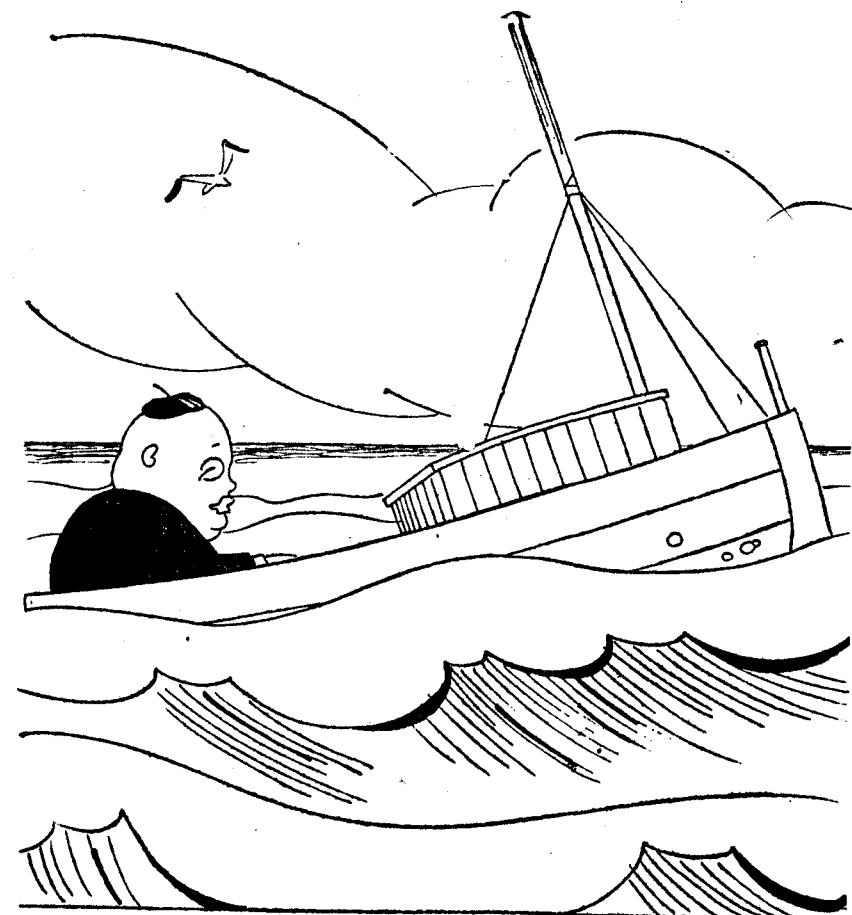
—Lo peor que me puede pasar es tropezar con una mina.